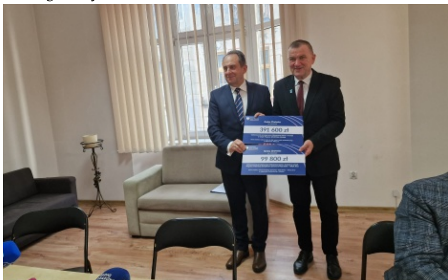
Promesy na inwestycje sportowe wręczone