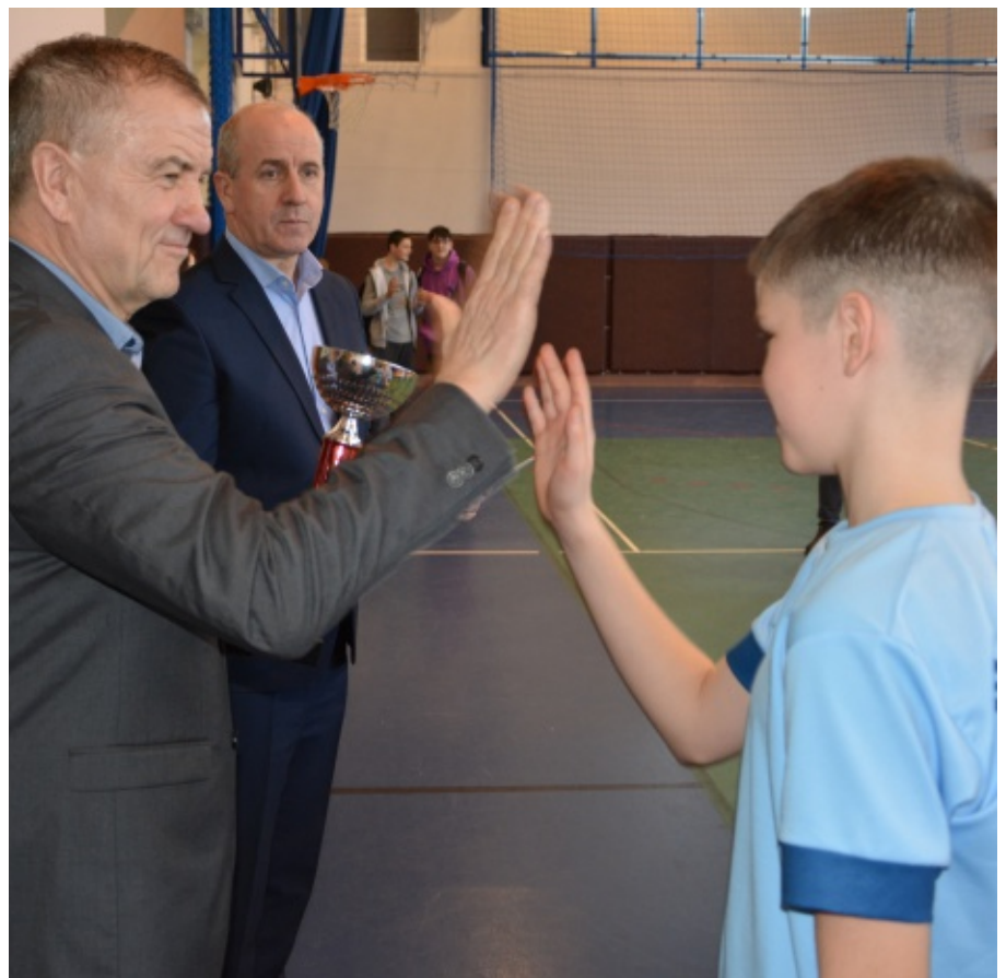
Mistrzostwa Gminy Chełmiec w piłce ręcznej Szkół Podstawowych