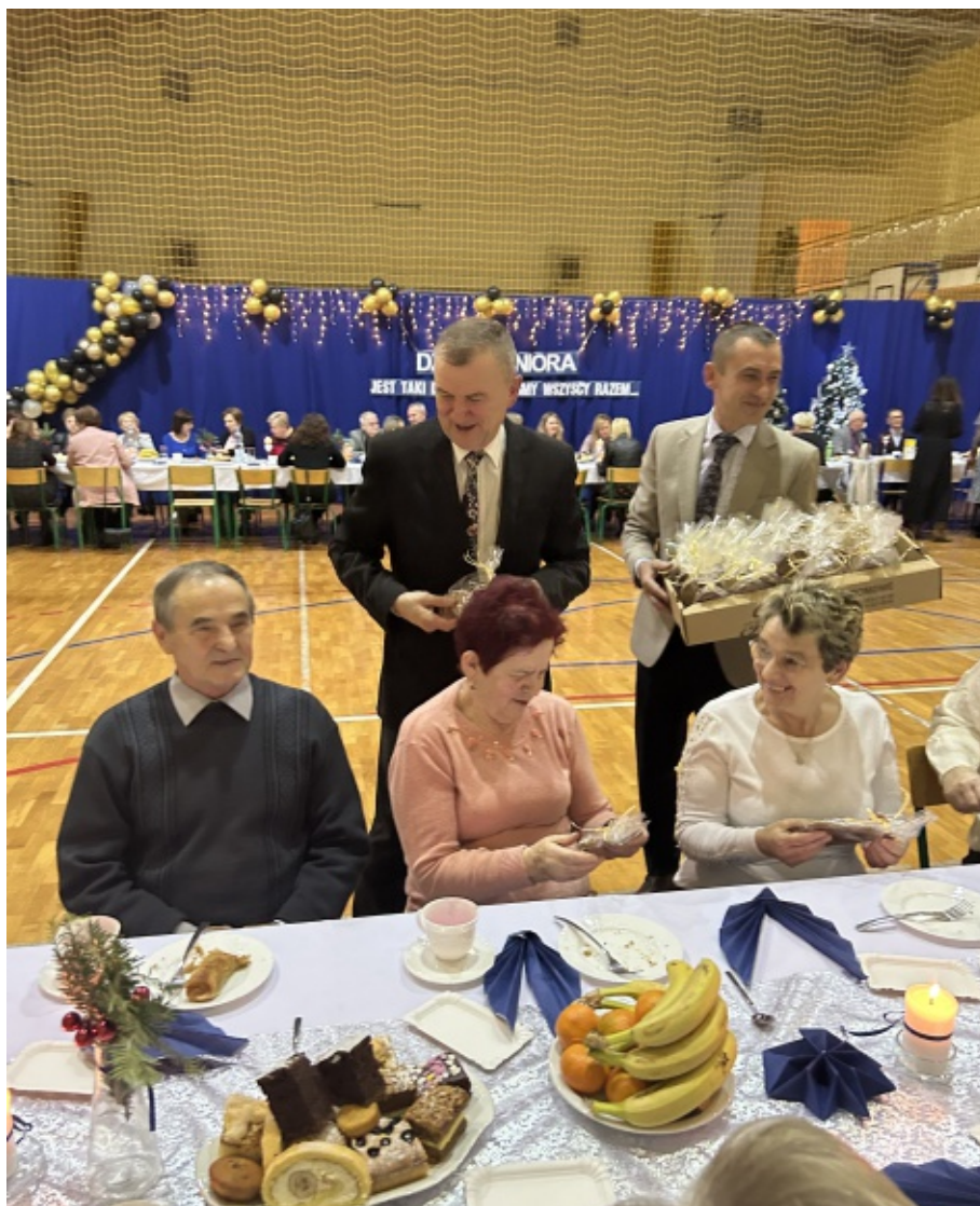
Noworoczne kolędowanie Seniorów w Piątkowej