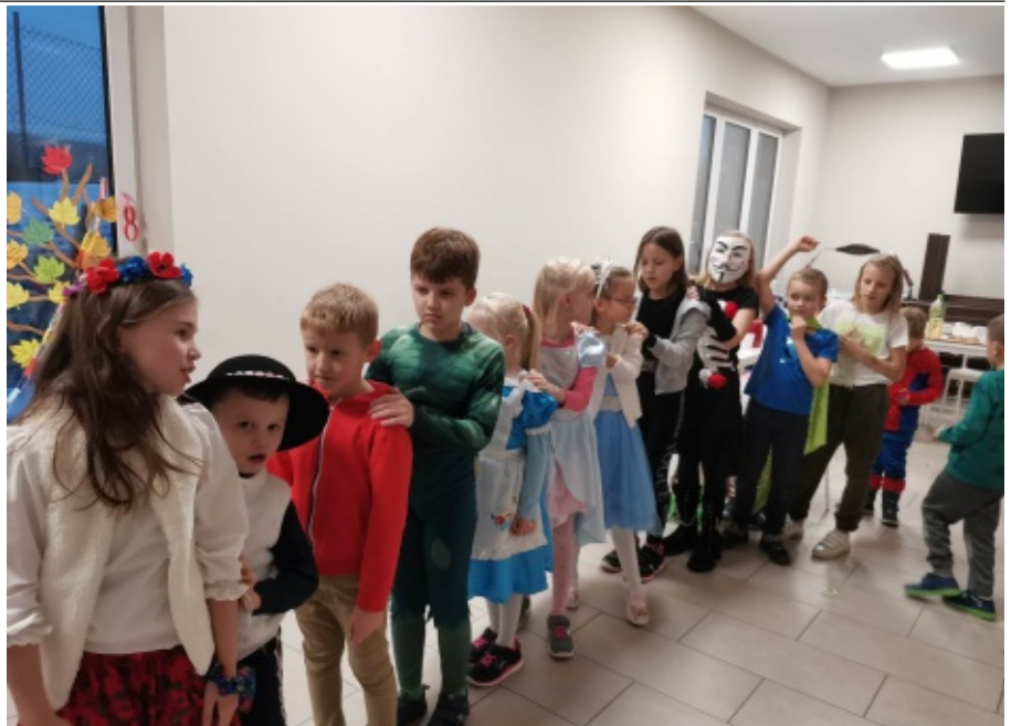
Najmłodsza świetlica w naszej gminie funkcjonuje już dwa lata.