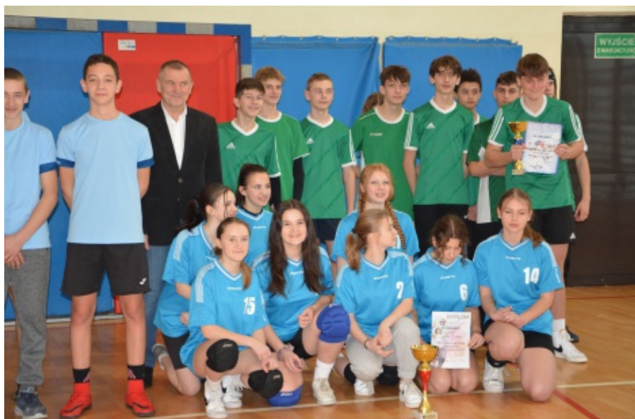
Mistrzostwa Gminy Chełmiec w piłce siatkowej klas VII - VIII

Mistrzem Gminy Chełmiec wśród chłopców została SP w Świniarsku a dziewcząt drużyna z SP w Chełmcu.