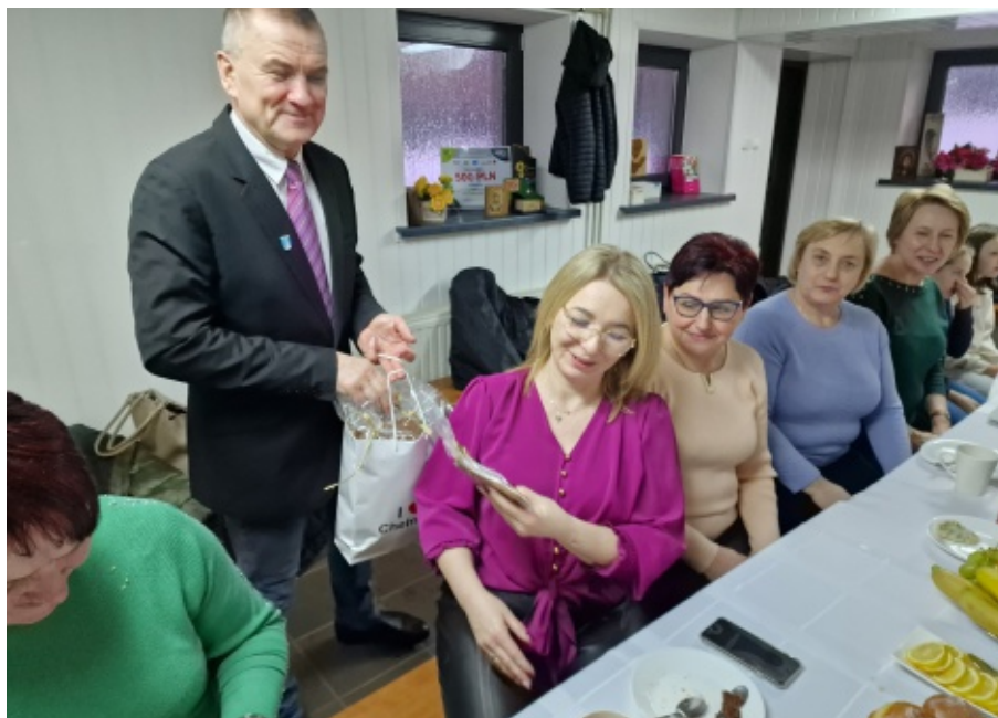
Spotkanie noworoczne w Woli Kurowskiej

prezentowały swoje umiejętności kulinarne częstując uczestników spotkania wyśmienitymi daniami. A.B.