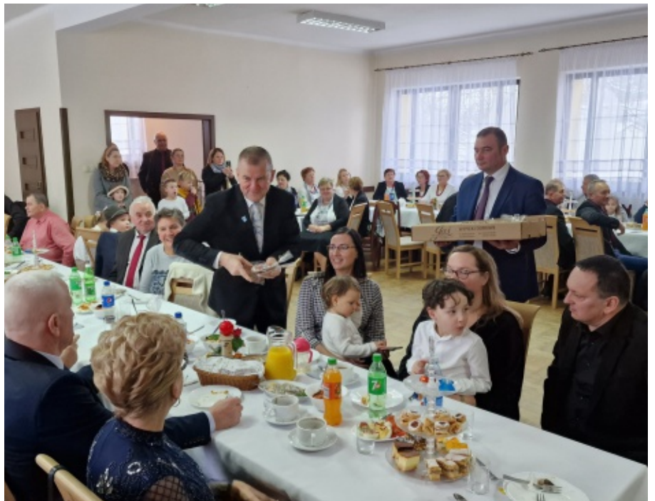
Spotkanie Noworoczne w Paszynie