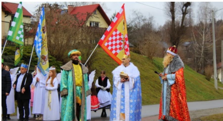
Pierwszy Paszyński Orszak Trzech Króli