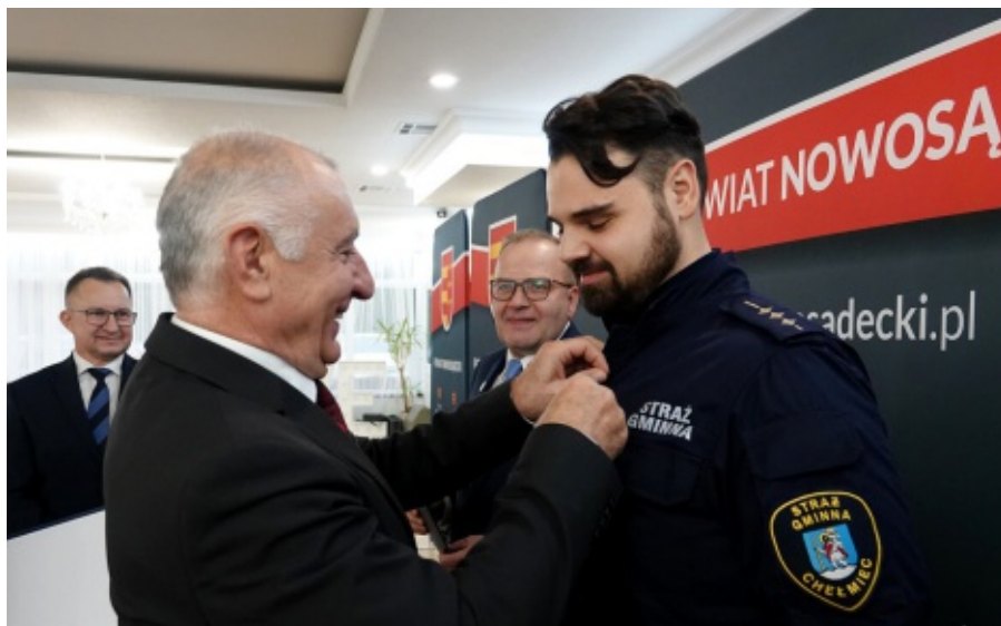
Spotkanie podsumowujące działalność służb, inspekcji i straży działających na terenie Powiatu Nowosądeckiego