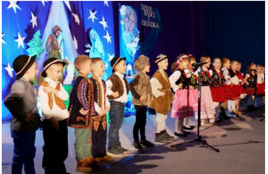
Dzień Babci i Dziadka w Szkole podstawowej w Świniarsku