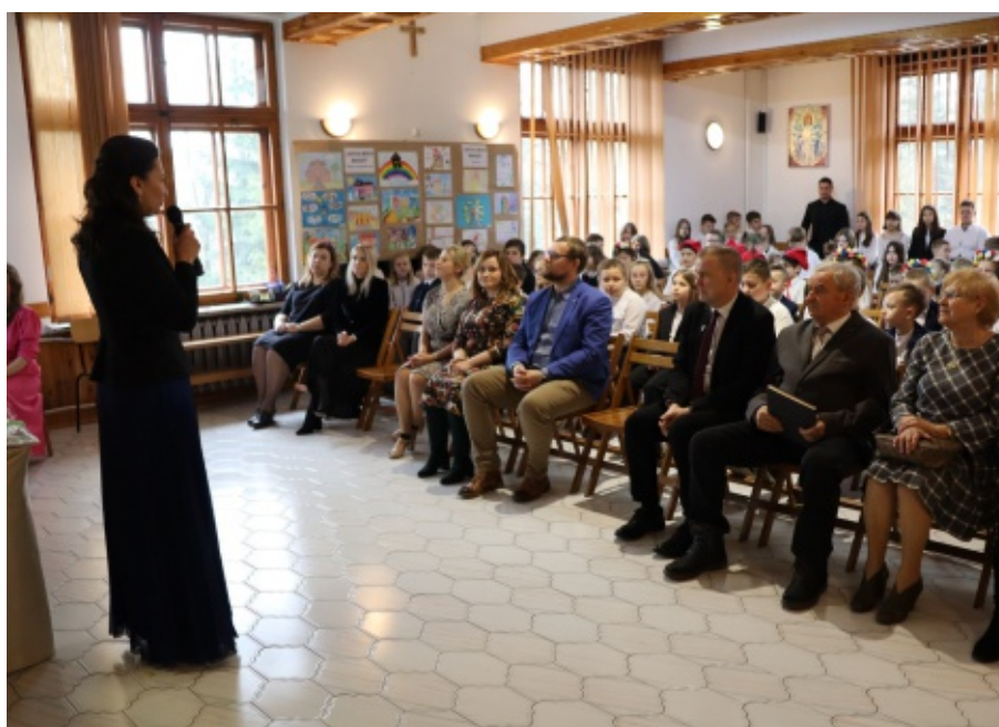
Święto Szkoły w Rdziostowie