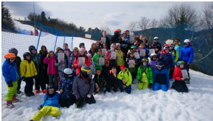
Mistrzostwa Gminy Chełmiec w narciarstwie alpejskim