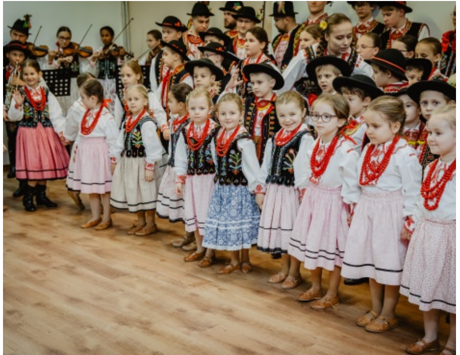
Noworoczne spotkanie u "Niskowioków"