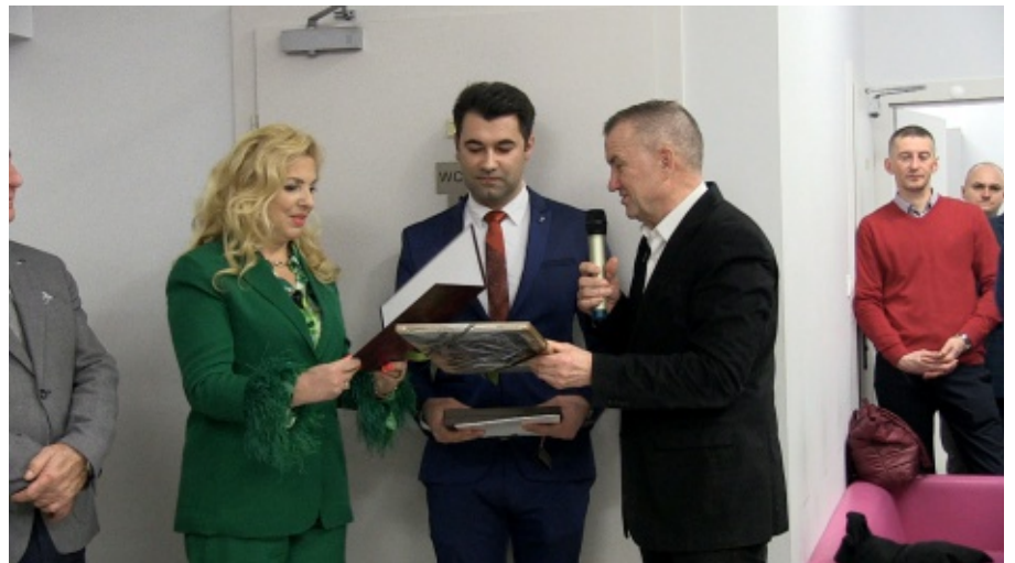
Otwarcie Placówki Pielęgnacyjno - Rehabilitacyjnej w Kłęczanach