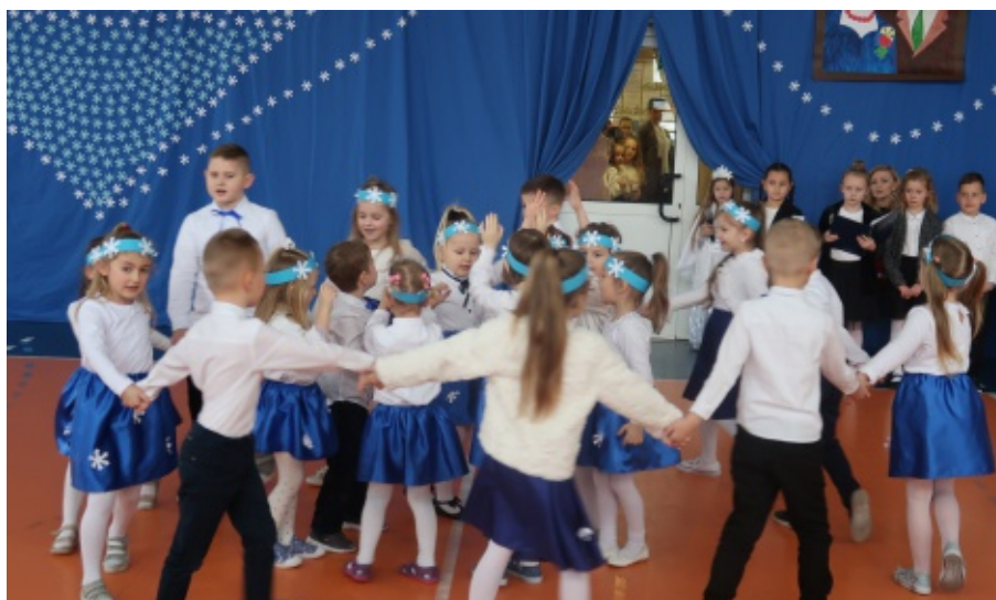
Dzień Babci i Dziadka w Trzetrzewinie