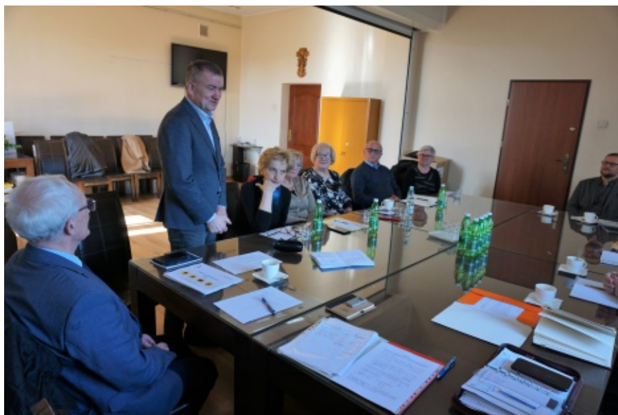
IX Posiedzenie Gminnej Rady Seniorów