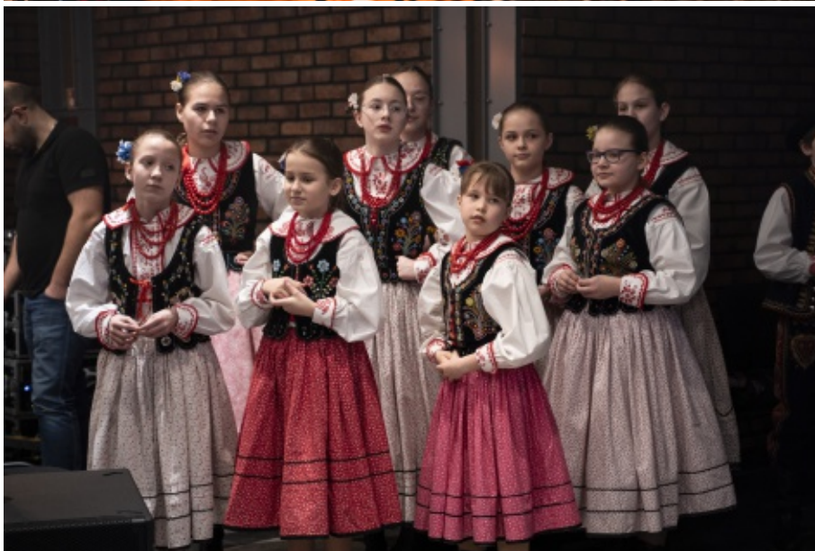
Wielki Jarmark Wielkanocny