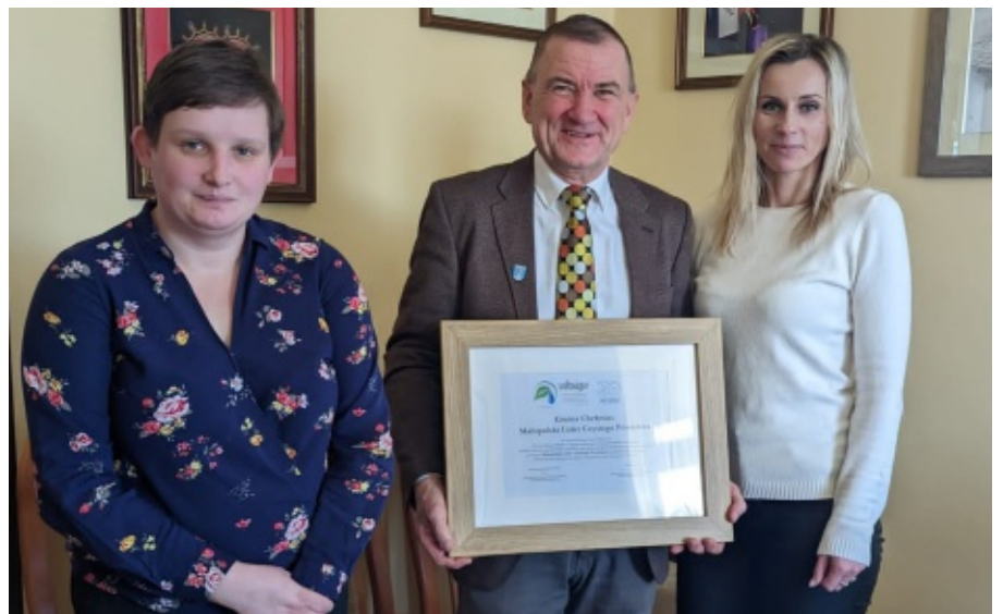
Małopolski Lider Czystego Powietrza wyróżnienie dla Gminy Chelmiec