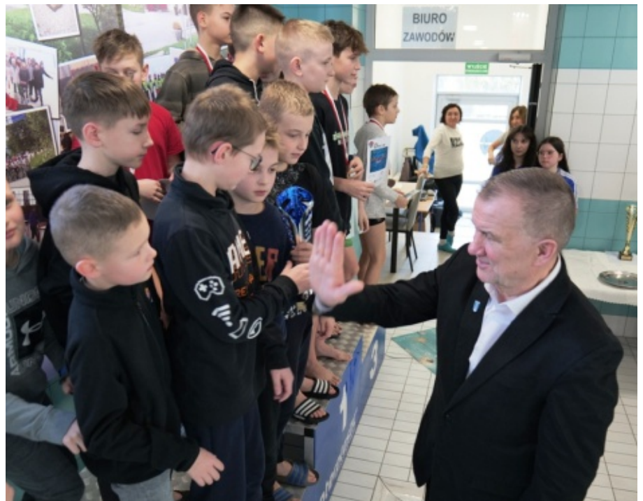
Pływackie „oczko” w Gminie Chełmiec.