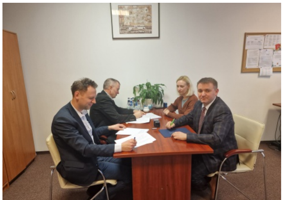
Umowa na inwestycje wodno – kanalizacyjne podpisana