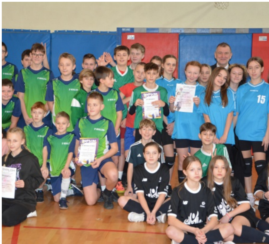
Zawody między gminne w mini piłce siatkowej.