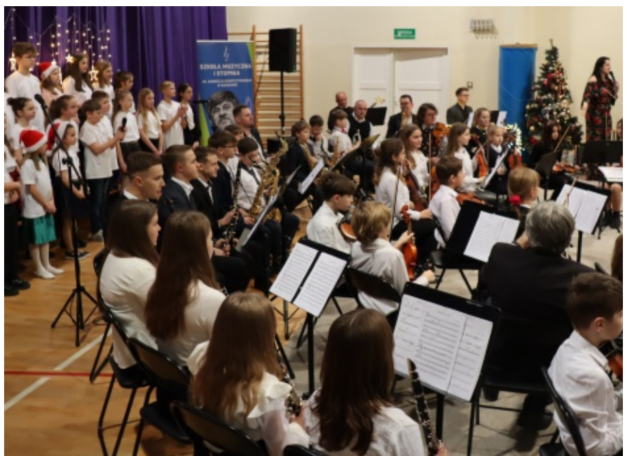
Koncert świąteczno -noworoczny Szkoły Muzycznej I stopnia