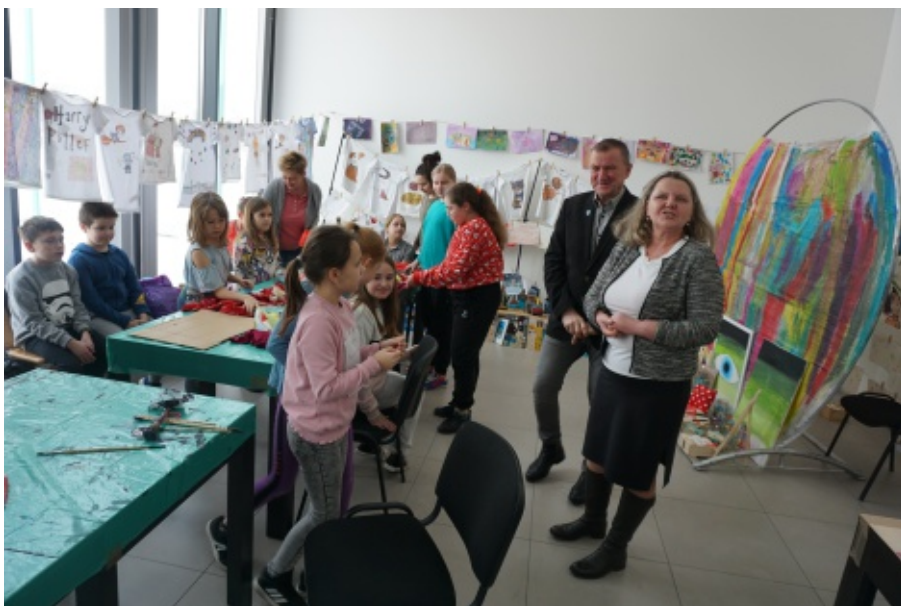
Warsztaty w Centrum Aktywnego Wypoczynku w Świniarsku