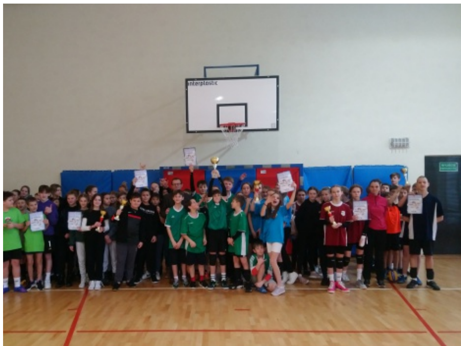
SP w Chełmcu Mistrzem Gminy Chełmiec w mini piłce siatkowej