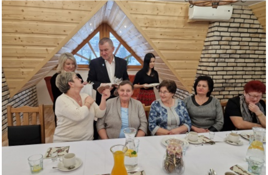
Spotkanie Klubu Seniora z Marcinkowic