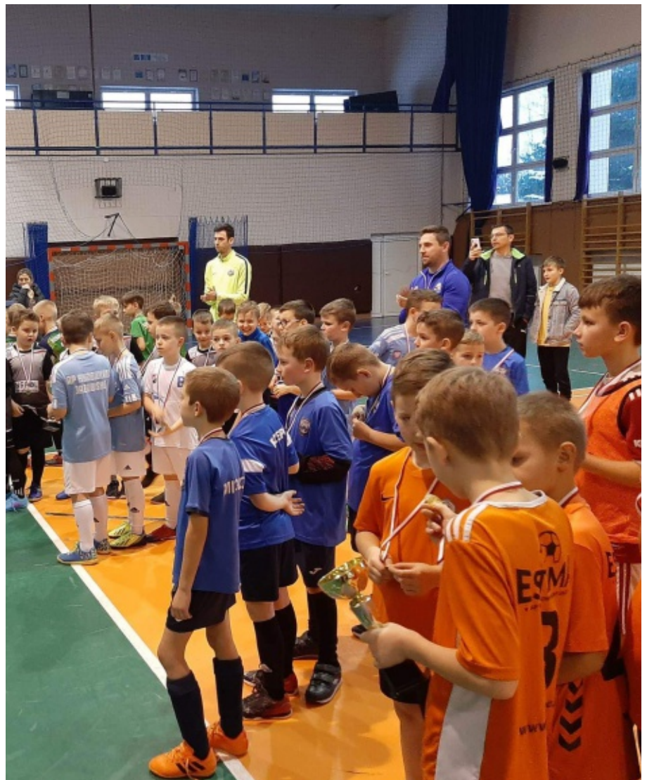
Turniej Chełmiec Cup