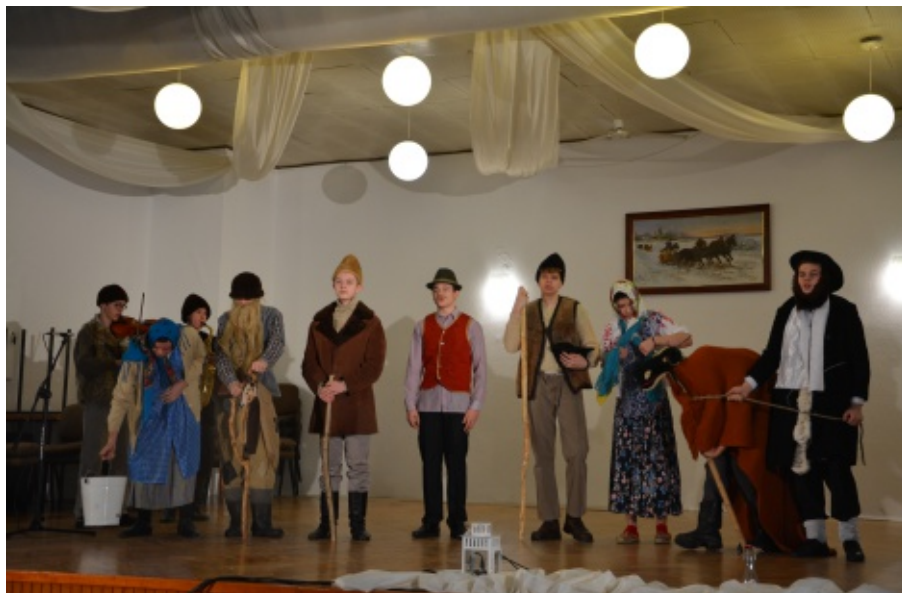
Przebierańcy w Kłęczanach