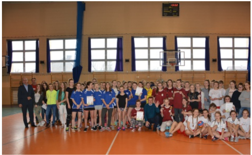
Piłka ręczna dziewcząt gimnazjum