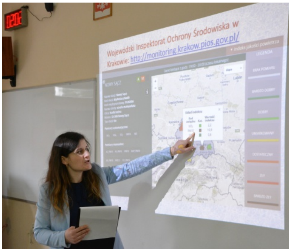
Co dzieci wiedzą o smogu