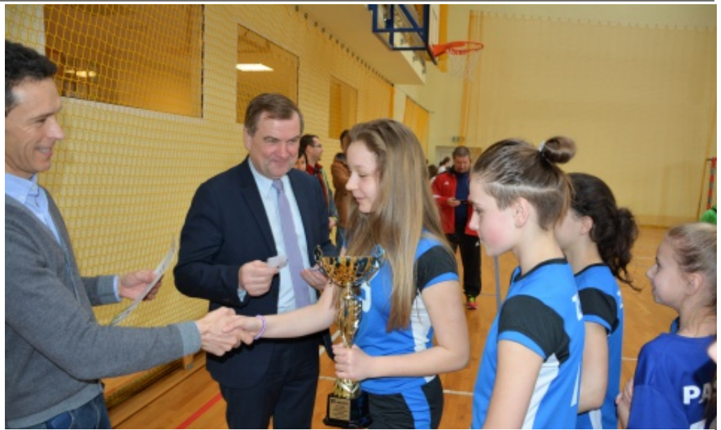
Zawody - piłka ręczna.