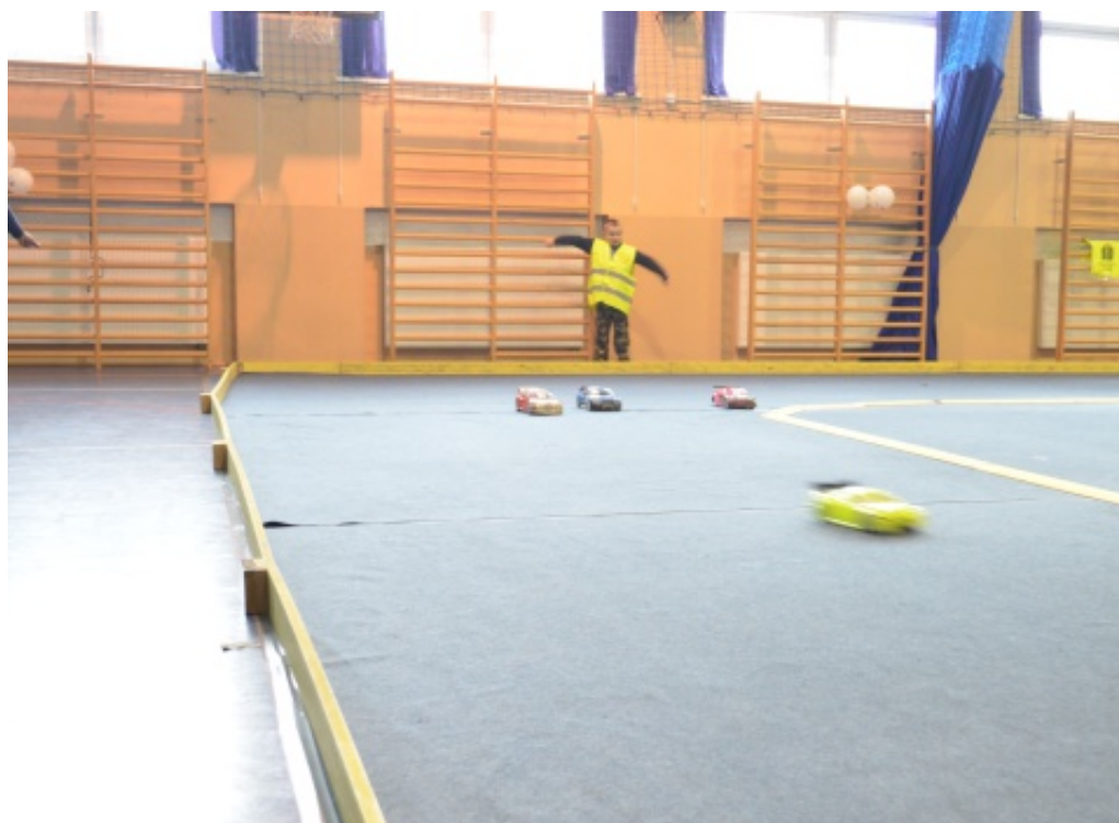
Zawody w Świniarsku

marca br. przez zawodników i osoby oglądające zawody zostanie zapamiętana jako "święto zdalnie sterowanych małych pojazdów w Świniarsku". E.Z.