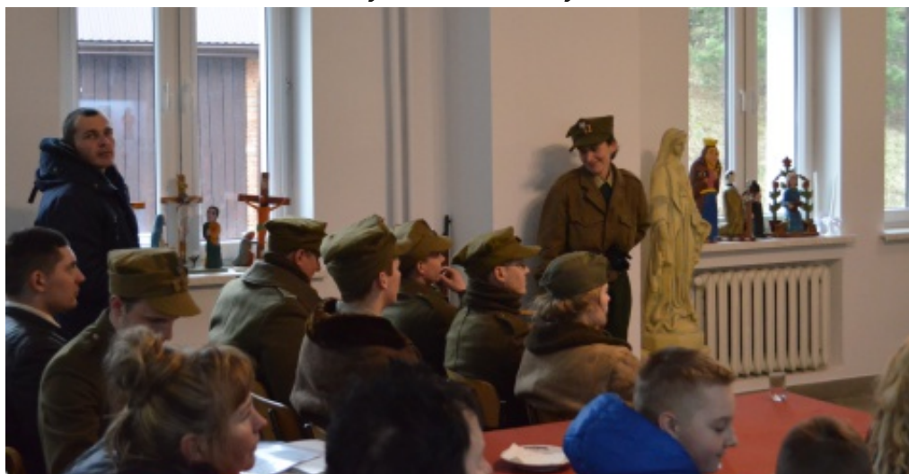
Dzień Pamięci "Żołnierzy Wyklętych" w Paszynie