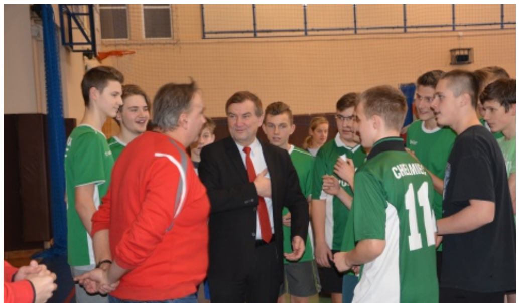
Zawody w siatkówce chłopców

Drużyna z Chelmecka reprezentowała gminę Chelmiec na zawodach międzygminnych. E.Z.