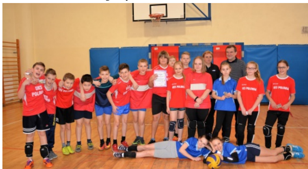
Zawody - siatkówka.

Drużyny z Chełmca uzyskały awans do Mistrzostw Powiatu Nowosądeckiego. E.Z.