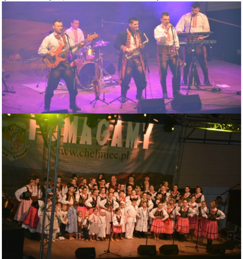
Koncert Charytatywny w Świniarsku