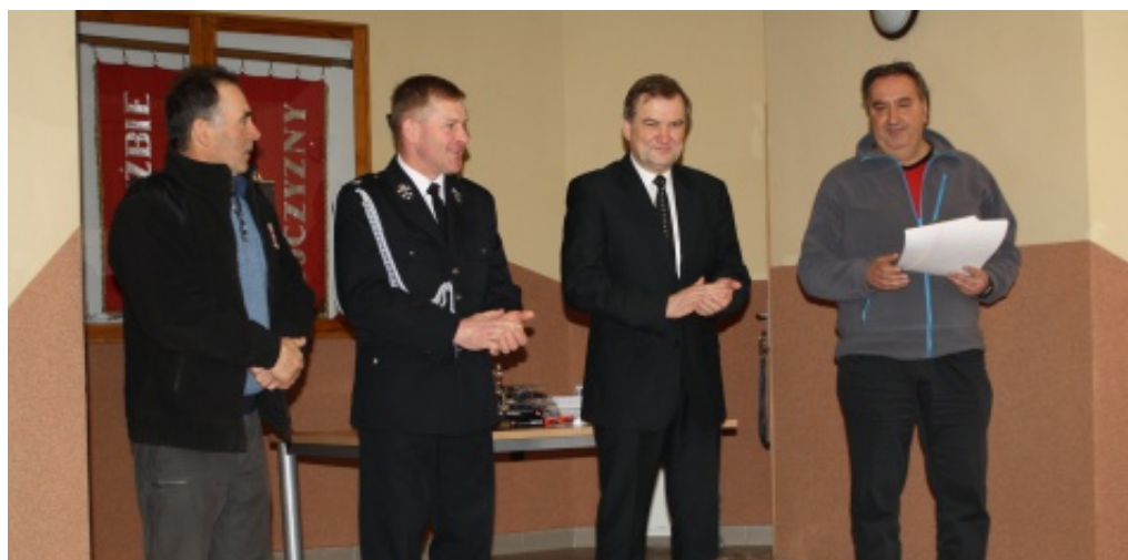
Konkurs wiedzy pożarniczej