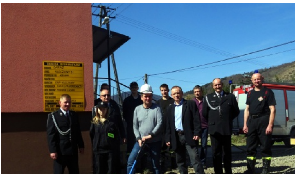
Rozpoczęcie budowy garażu dla OSP

dantem Gminnym OSP oraz obecnymi strażakami OSP Klęczany.