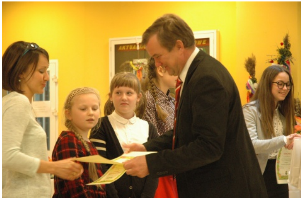
Konkurs Tradycji Wielkanocnych