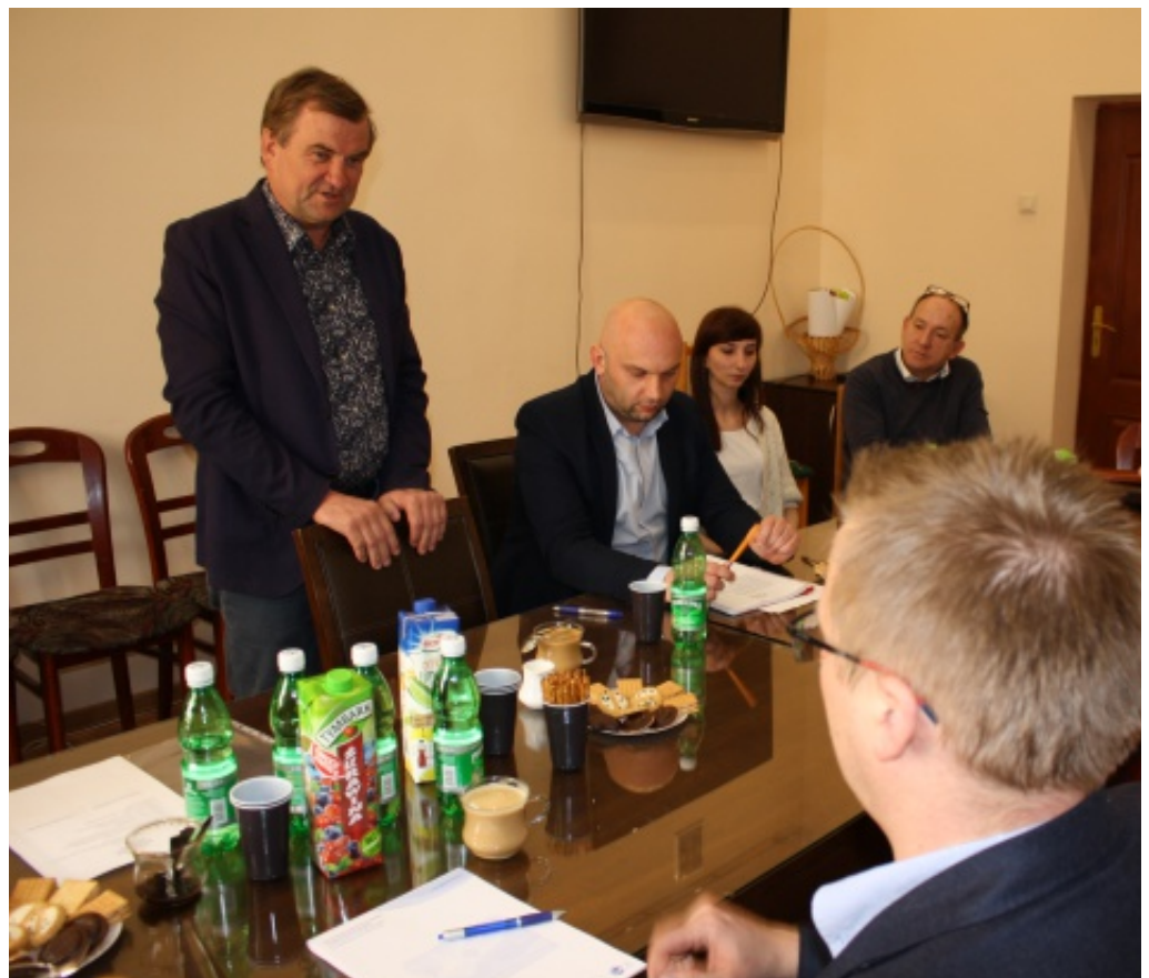
Nowa forma współpracy LGD

Wszystkich zainteresowanych zapraszamy do współpracy. Siedziba oraz biuro związku będą mieścić się w Chełmcu (ul. Papińska 2, tel. 184145655/660675601). A.B.