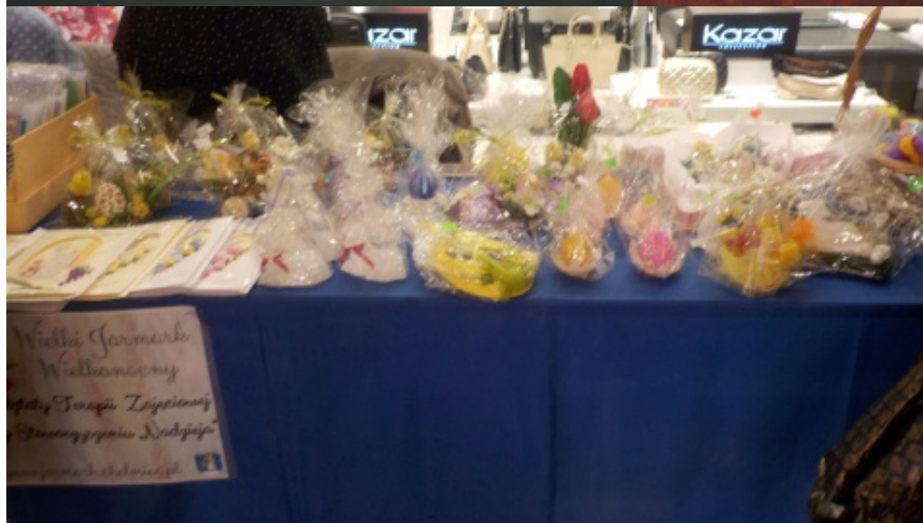
Wielki Jarmark Wielkanocny