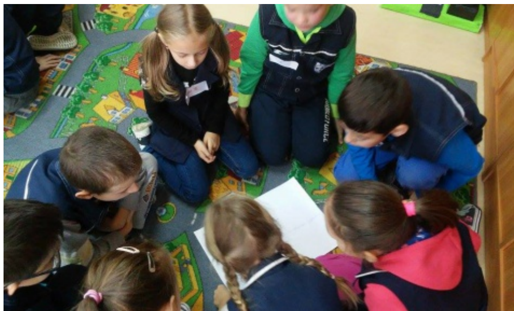
Czyste powietrze – czysta sprawa

obszar Kotliny Sądeckiej wyemitowano ponad 300 razy spot informacyjny na temat szkodliwości smogu, oraz 5 audycji dotyczących sposobów przeciwdziałania zanieczyszczeniom. Patronem medialnym przedsięwzięcia było radio RDN Nowy Sącz.