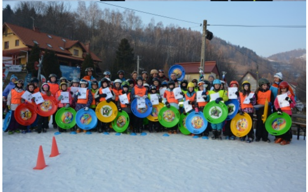
Jeżdżę z głową