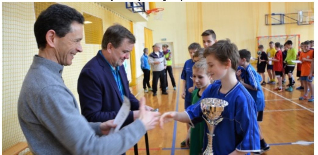
Mistrzostwa gminy Chelmiec w piłce ręcznej