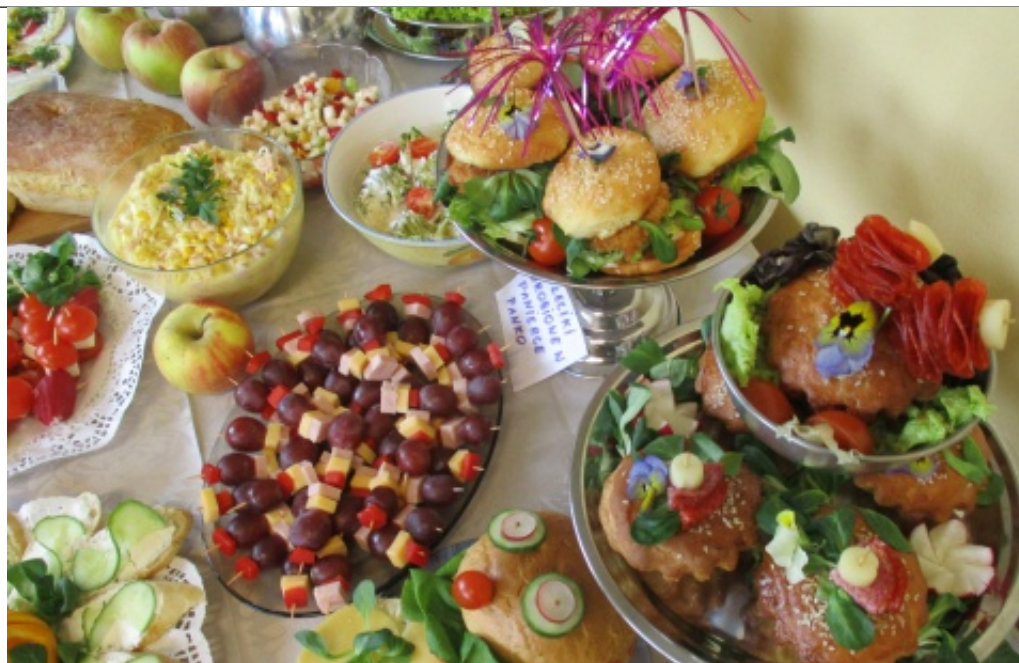
Dzień zdrowej żywności w Biczycach Dolnych