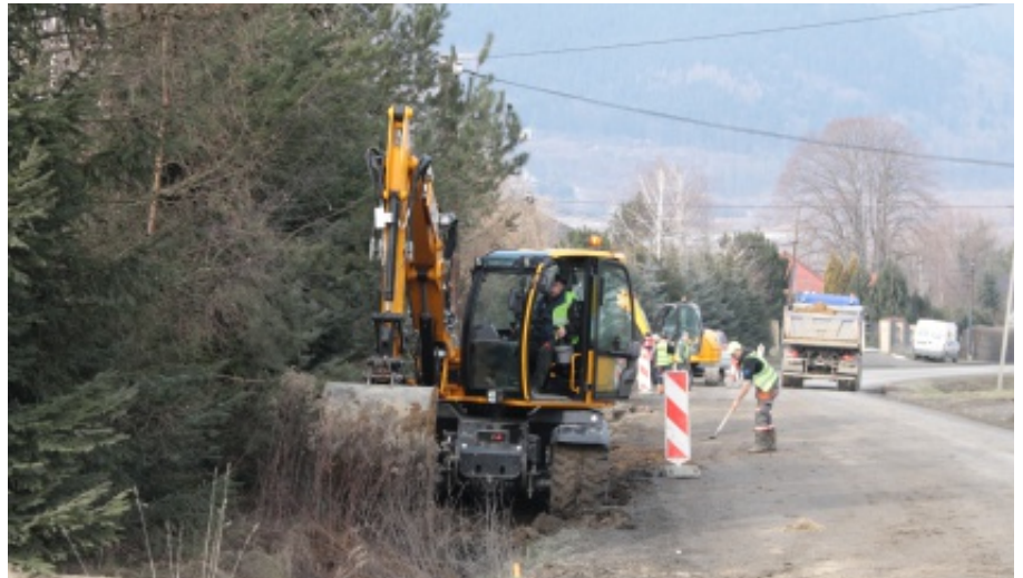
Budowa chodnika Chomranice - Rdziostów

wej Biczycy Dolne - Gostwica w miejscowościach Biczycy Dolne i Niskowa za kwotę 1 750 000 zł. A.B.