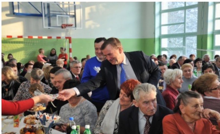
Dzień Seniora w Chomranicach