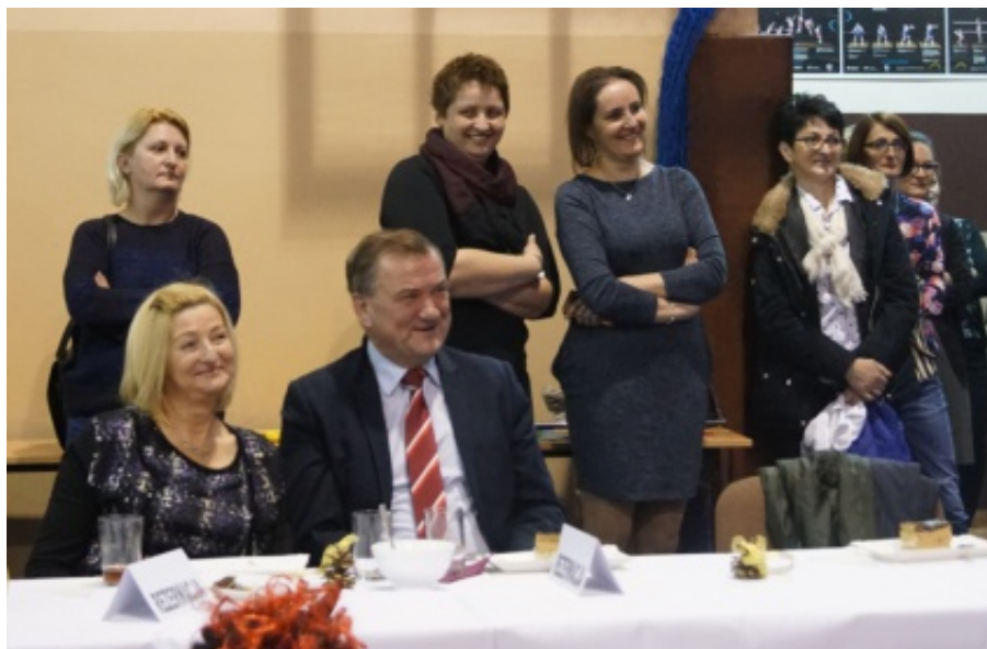
Dzień Babci i Dziadka w Świniarsku