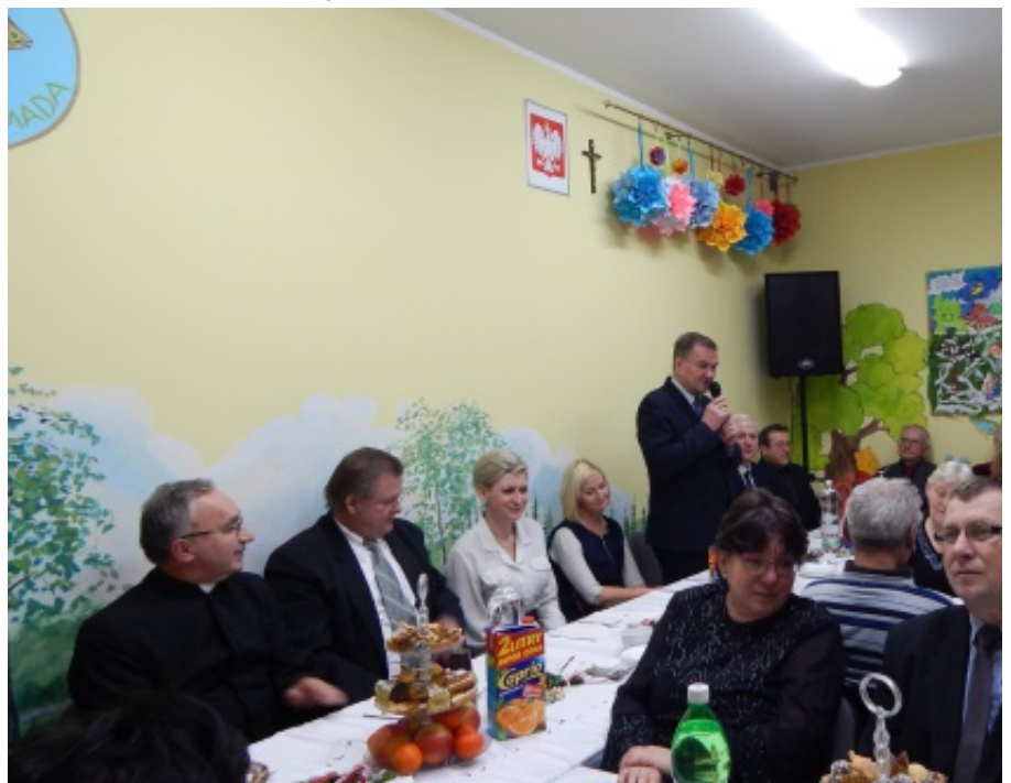
Seniorzy w Małej Wsi