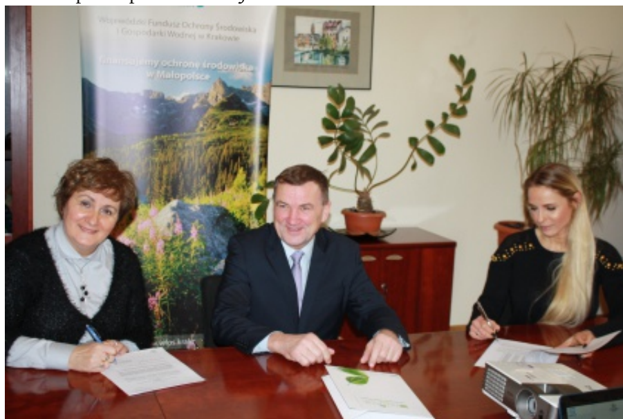
Podpisanie umowy na budowę wodociągu