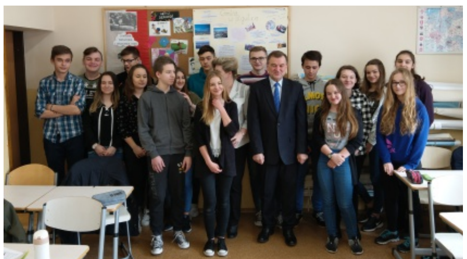
Lekcja z udziałem wójta gminy

gadnień związanych z zadaniami jakie spoczywają na samorządzie gminnym i obowiązkach wójta. Wójt opowiadał między innymi o: budżecie naszej gminy, ochronie środowiska i inwestycjach na jej terenie. Podczas spotkania poruszono zagadnienia związane z drogami gminny-