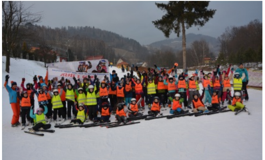
IV edycja "Jeżdż z Głową"

na zasadzie 6 wyjazdów w każdą sobotę i niedzielę, począwszy od dnia 27 stycznia br., w ilości 18 godzin dla każdej grupy. Miejsce realizacji projektu była Sta-