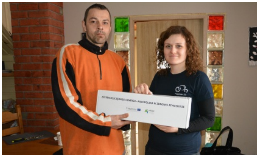
Akcja oszczędzam energię