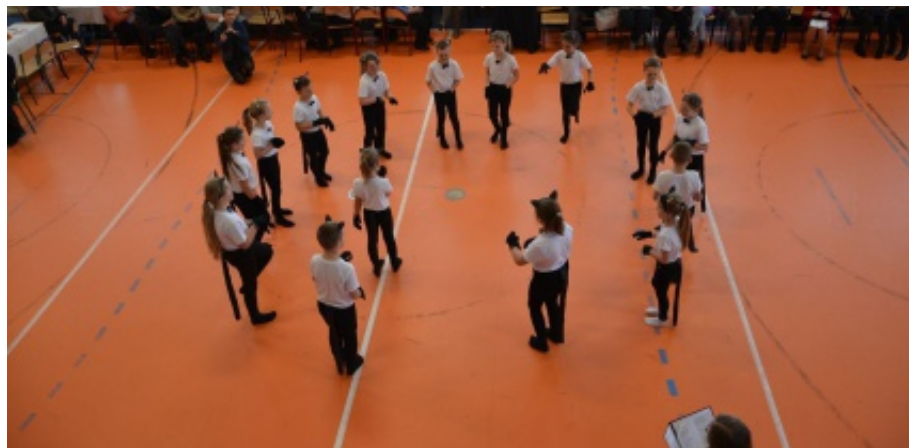
Dzień Seniora w Trzetrzewinie

Spotkanie to sprawiło Seniorom wiele radości. R.P.