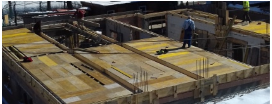
Budowa przedszkola w Paszynie

rytmika, taniec, plastyka, gimnastyka korekcyjna, hipoterapia, dogoterapia oraz z specjalistycznej porady logopedy i psychologa. Z środków projektu planuje się także w pełni wyposażać 2 oddziały przedszkolne oraz zakupić sprzęt multimedialny, pomoce dydaktyczne i zabawki. M.B.