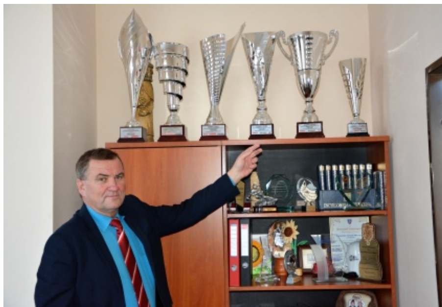
Gmina Chełmiec Najlepszą Gminą Wiejską w Polsce