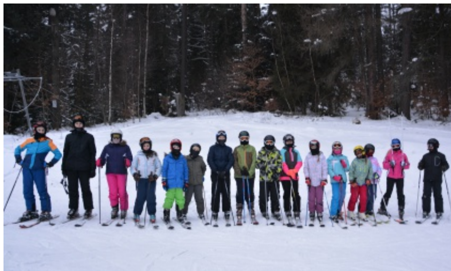
Upowszechnianie sportów zimowych