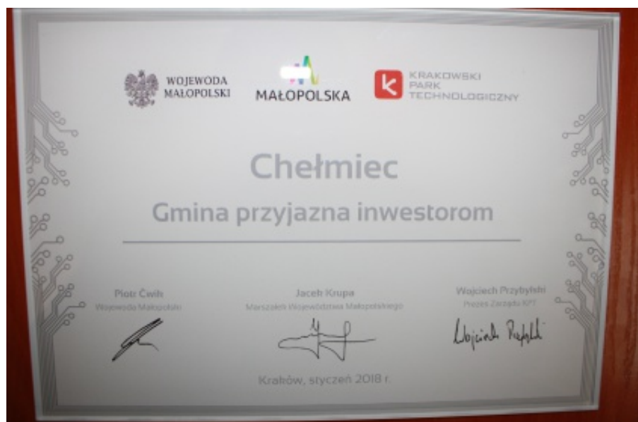
Wyróżnienie dla gminy Chełmiec