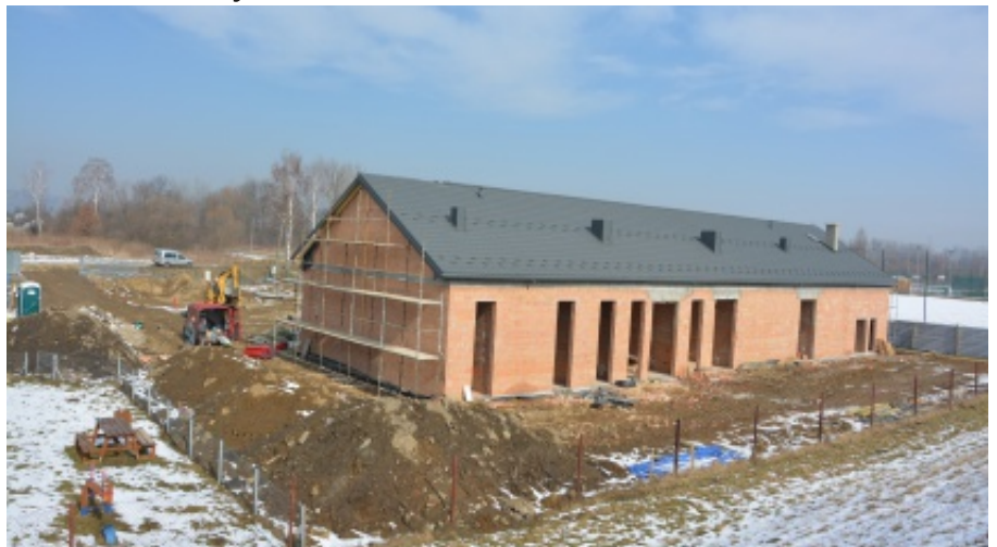
Budowa Centrum Aktywnego Wypoczynku w Świniarsku