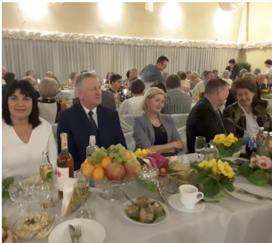
Spotkanie Seniorów w Klęczanach