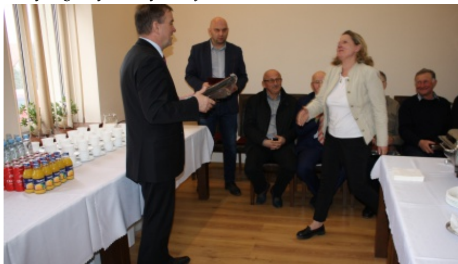
Dzień Sołtysa w gminie Chelmiec