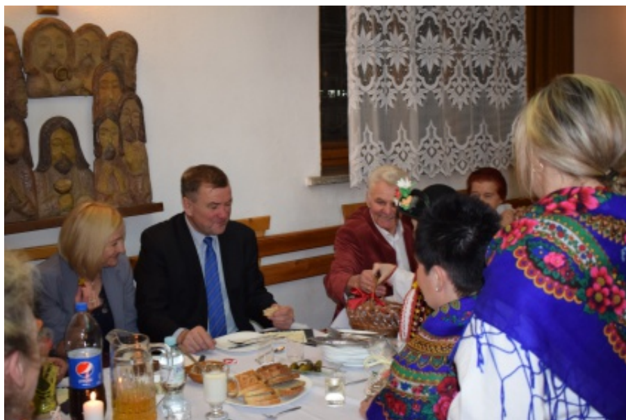
Wieczorek Seniora w Marcinkowicach