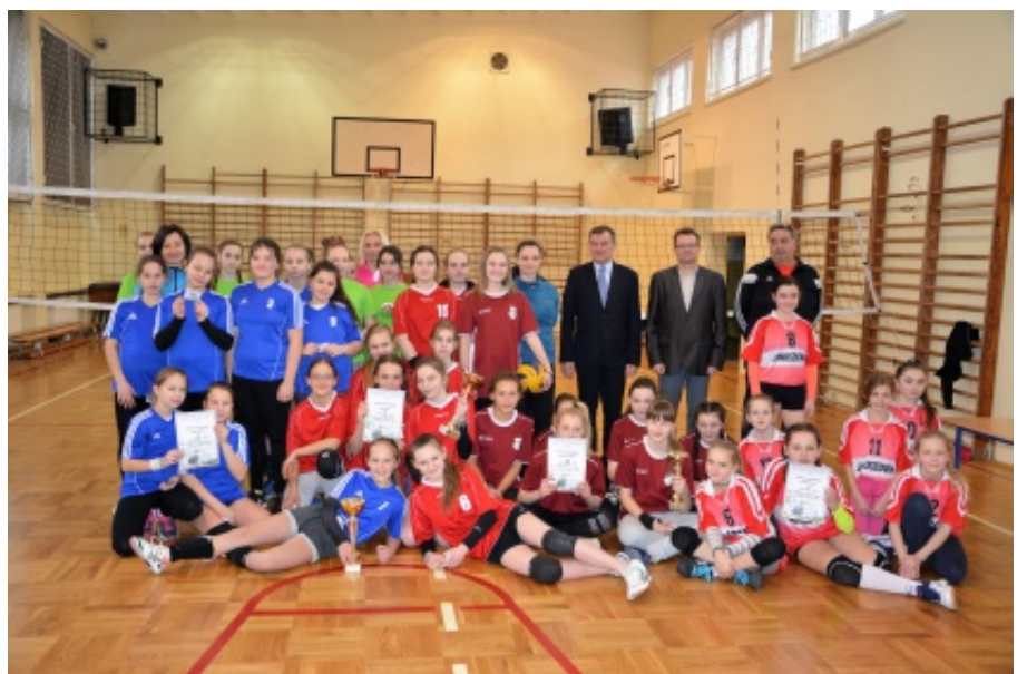
Mistrzostwa Gminy w siatkówce