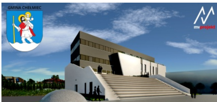
XLI Sesja Rady Gminy

Głównym odbiorcą nowej oferty kulturalno-edukacyjnej w postaci obserwatorium astronomicznego będą uczniowie, w tym członkowie koła astronomicznego z Zespołu Szkół im. M.Kopernika w Chełmca. Przewidujemy, że w obserwatorium astronomicznym będą się odbywać zajęcia z fizyki i astronomii dla dzieci i młodzieży ze wszystkich szkół z terenu gminy Chełmec. M.B.