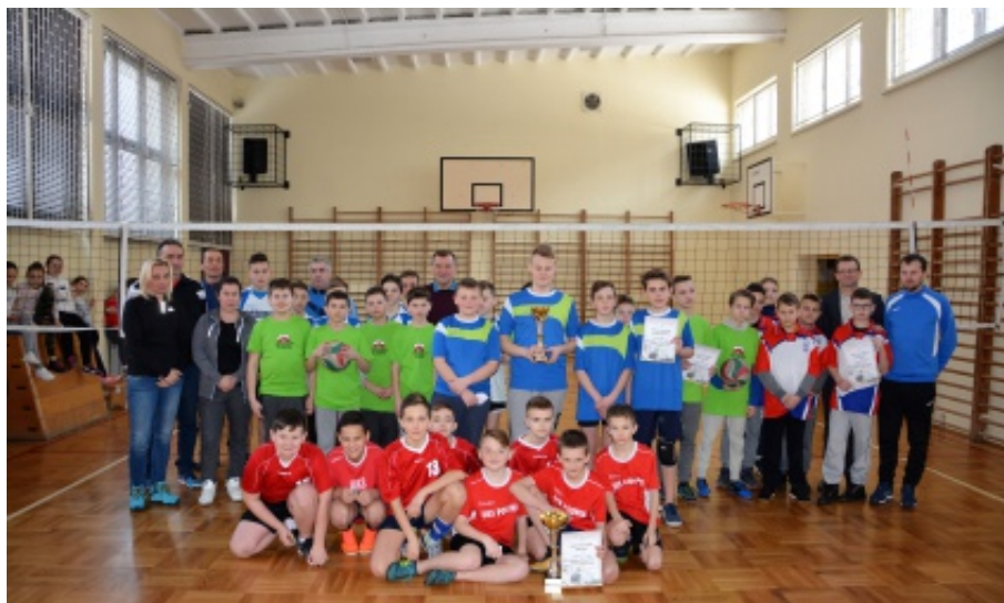
Mistrzostwa Gminy w siatkówce