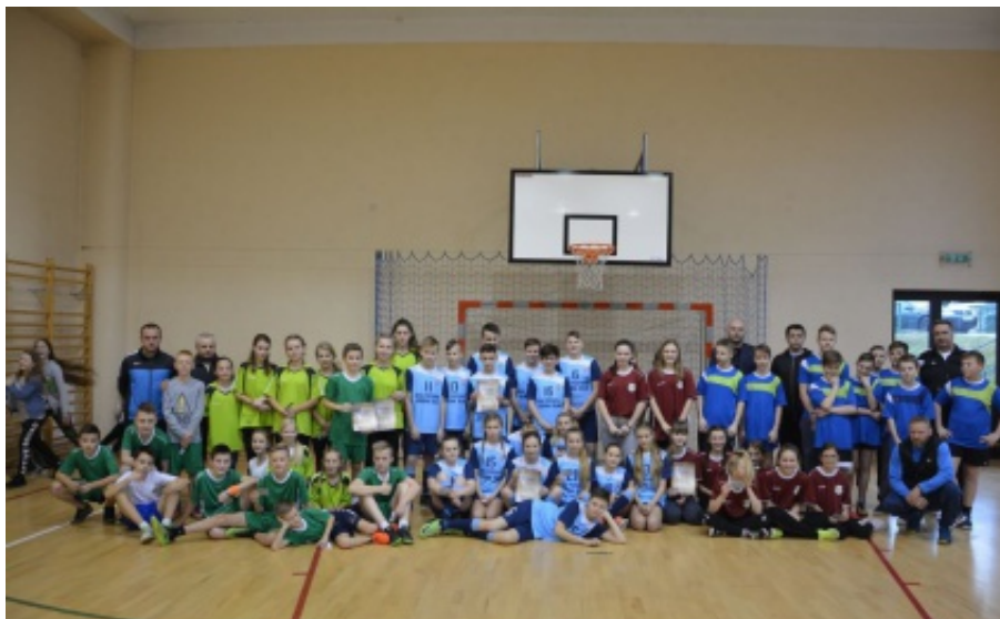
Zawody międzygminne w minikoszykówce