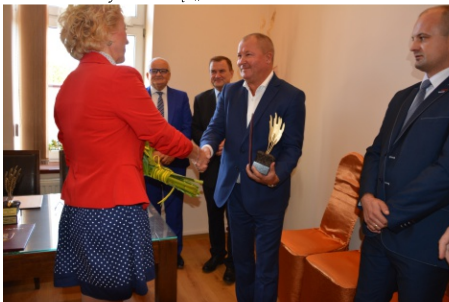
Zasłużony dla gminy Chełmiec