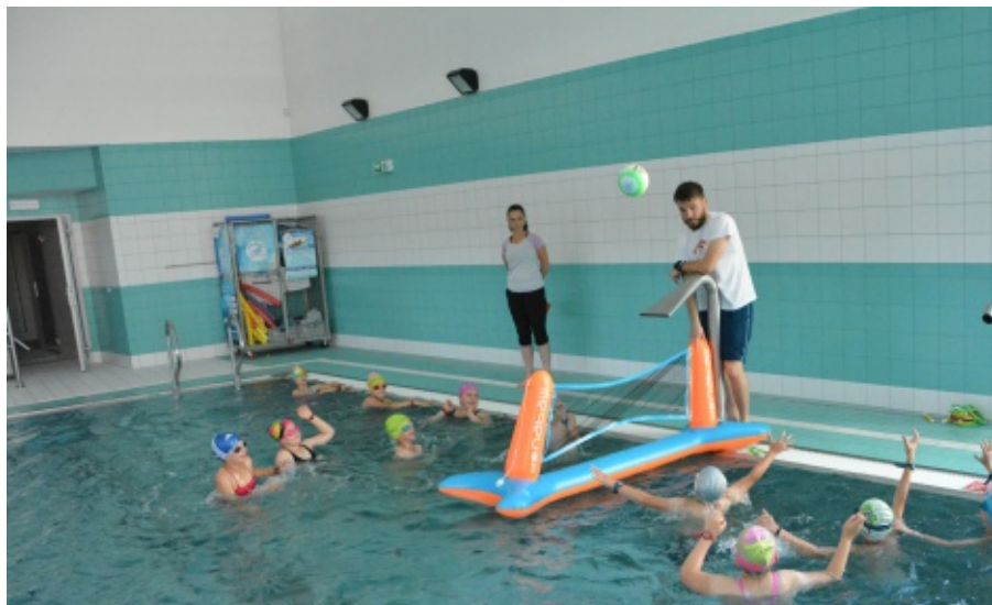
Bezpieczne wakacje w wodzie.

W zakończonych zajęciach łącznie udział brało 477 dzieci