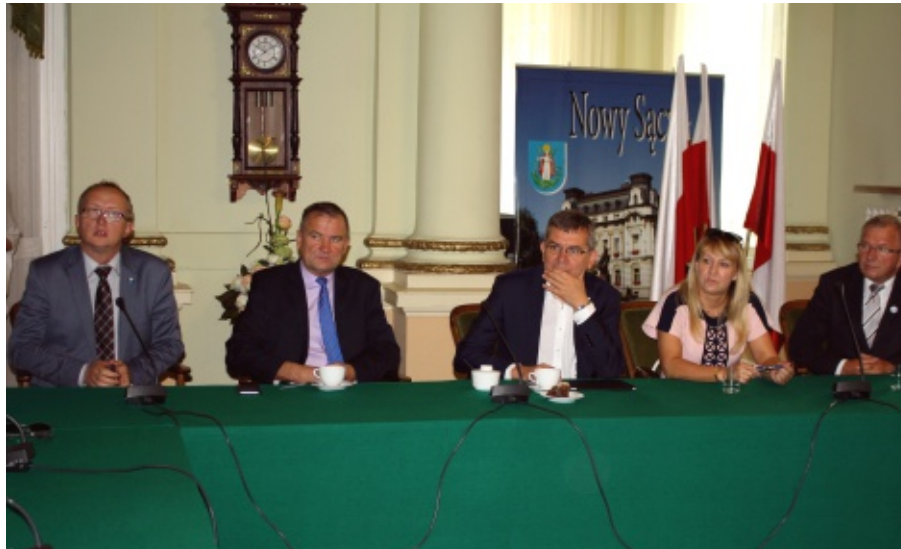
"Kotlina Sądecka w zdrowej atmosferze"

W ramach tego działania samorządy mogą ubiegać się o dofinansowanie w wysokości 60% do zakupu i montażu kolektorów słonecznych, ogniw fotowoltaicznych, wiatraków, pomp ciepła