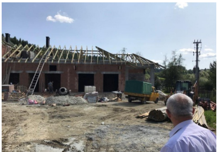
Budowa oczyszczalni ścieków dla miejscowości Paszyn

z dwoma oddziałami przedszkolnymi dla 50 dzieci nowym parkingiem i placem zabaw. Inwestycja szacowana jest na przeszło 3 miliony złotych. Przedszkole uruchomione zostanie w połowie przyszłego roku. B.Ś.