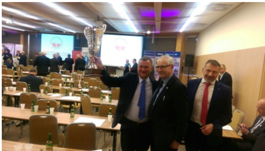
Chełmiec – najlepsza gmina wiejska 2016r.