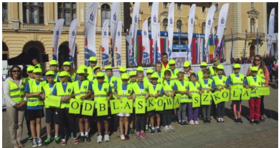
Odblaskowa Szkoła z Rdziostowa