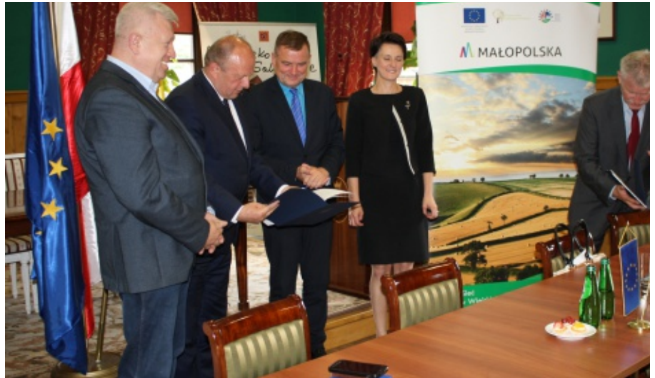
Wręczenie umów dotacji na budowę kanalizacji