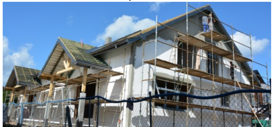
Żłobek w Biczycach Dolnych w budowie

planowane jest na 15 listopada 2017 roku. Żłobek rozpocznie swoją działalność w grudniu i przez okres 12 miesięcy, zgodnie z warunkami programu będzie bezpłatny. Już wkrótce rozpoczną się zapisy dzieci do żłobka. Zgodnie z regulaminem pierwszeństwo w przyjęciach wniosków będzie skierowane do matek powracających na rynek pracy po przerwie związanej z macierzyństwem, oraz mieszkańców gminy Chełmiec. M.B.