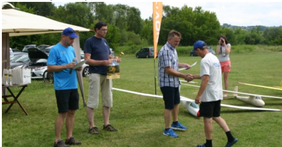
Szybowce w Kurowie

liczny udział zawodników w przyszłorocznych zawodach. E.Z.