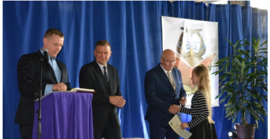
Stypendia Wójta za wyniki w nauce