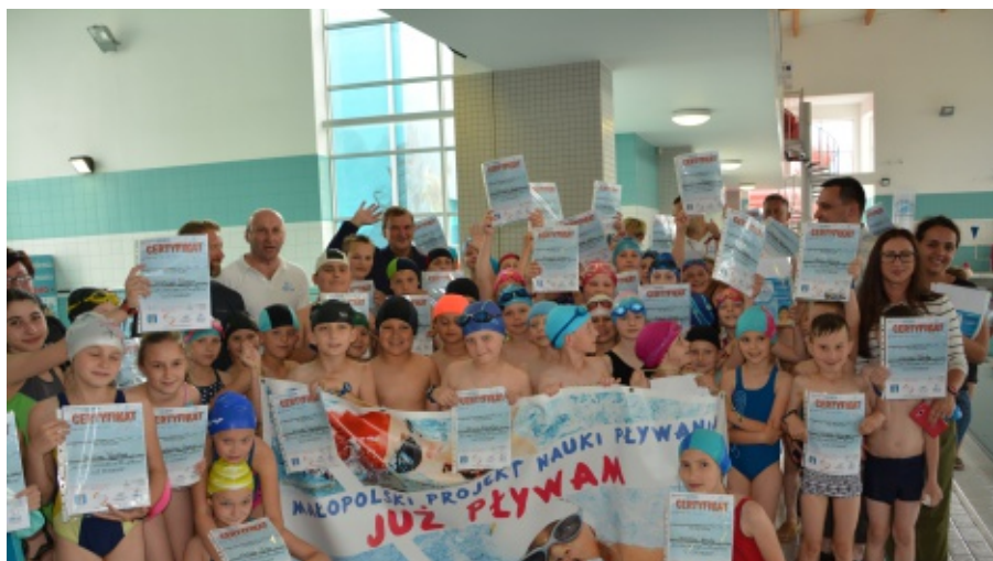
Projekt "Już Pływam"

Zajęcia odbywały się w wymiarze 1,5 godziny zegarowej – raz w tygodniu. Całość obejmowała 16h zajęć na basenie. Każdy uczestnik projektu miał zapewniony: transport, zajęcia z instruktorem pływania, bilety wstępu na basen oraz opiekę opiekuna każdej z grup. E.Z.