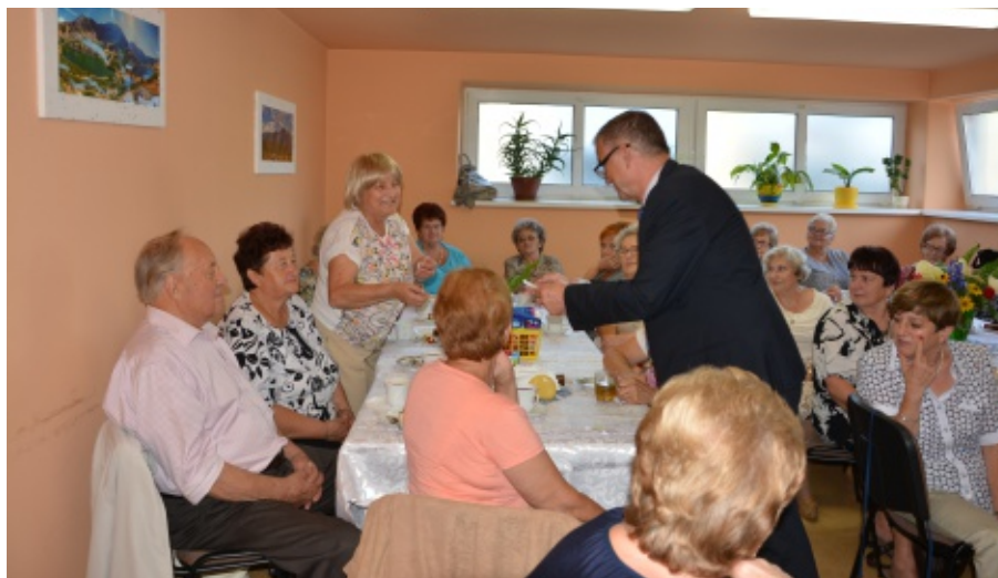
Spotkanie Klubu Seniora w Chełmcu