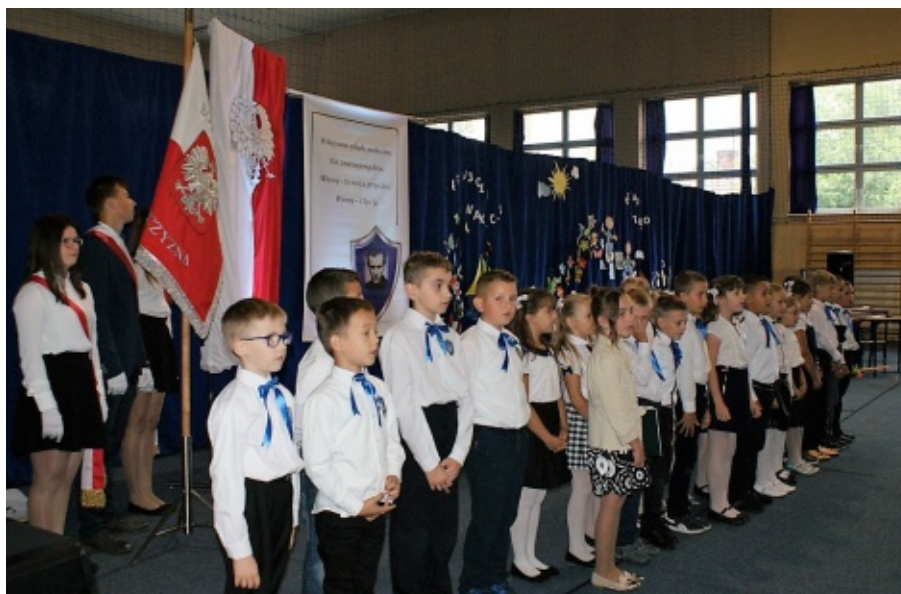
Inauguracja roku szkolnego 2017/2018 w Świniarsku