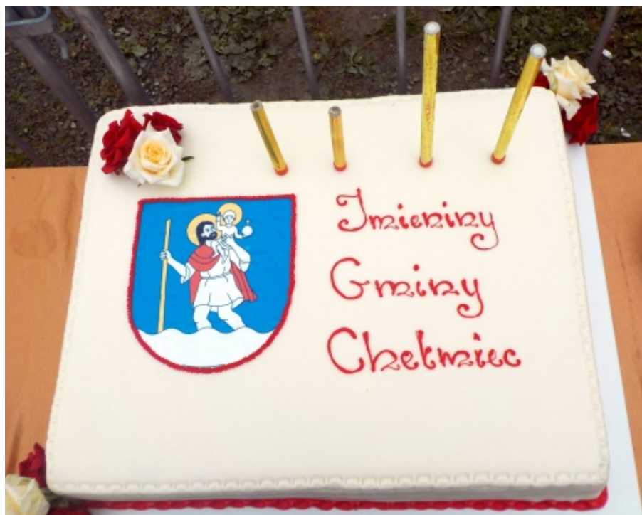
Imieniny Gminy Chełmiec.