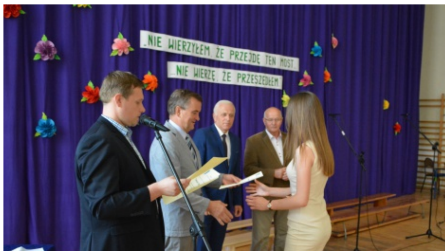
Wręczenie nagród za wybitne osiągnięcia