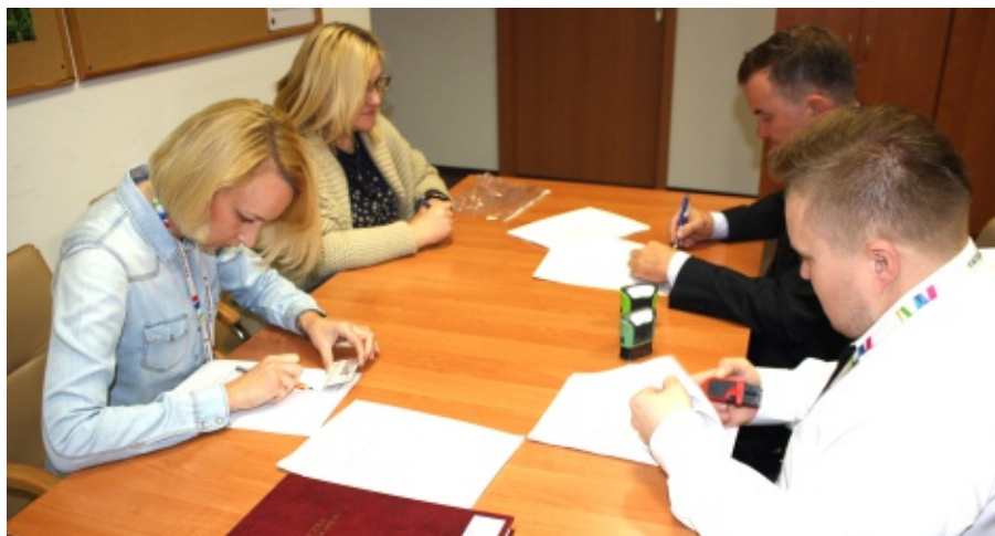
Podpisanie umowy na budowę placów zabaw.