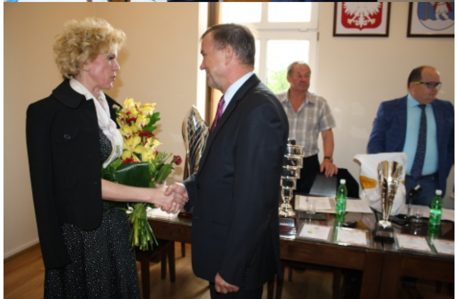
Absolutorium dla wójta