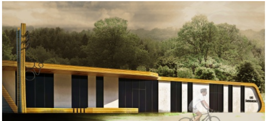
Wizualizacja centrum aktywnego wypoczynku