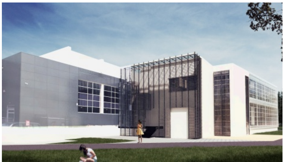
Wizualizacja Aquacentrum po rozbudowie

Aqua Centrum Chełmec cieszy się rosnącym zainteresowaniem, coraz więcej ludzi (również spoza gminy Chełmec) korzysta z usług oferowanych przez Aqua Centrum. Średnio w ciągu każdego dnia na basenie jest około 500 osób (rekord to 1000 wejść w ciągu doby!). Coraz większa popularność Aqua Centrum, oraz prośby wielu mieszkańców i użytkowników basenu wpłynęły na decyzję o jego rozbudowie. W nowo wybudowa-