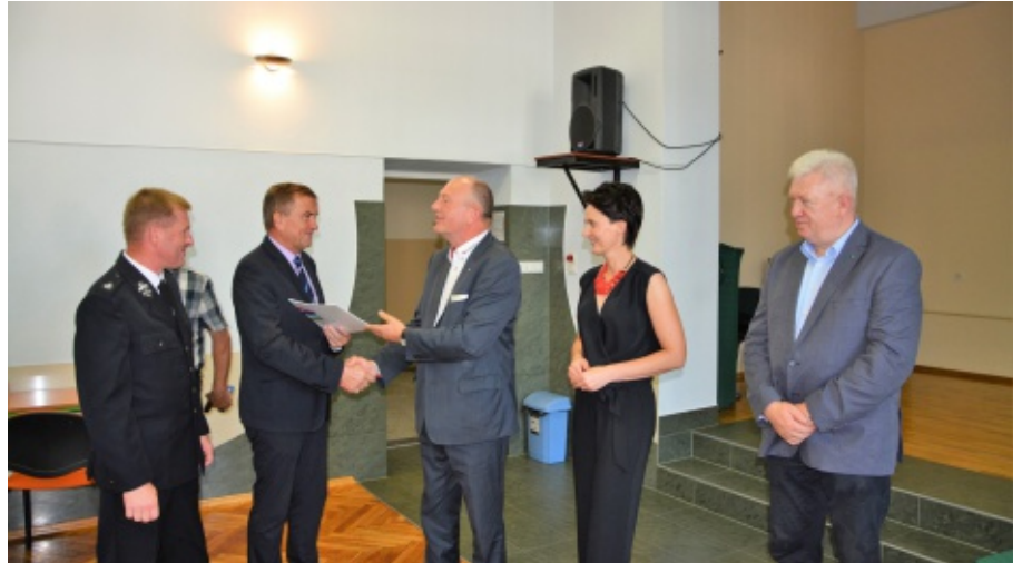
Wręczenie umowy w ramach konkursu "Małopolskie Remizy 2017"