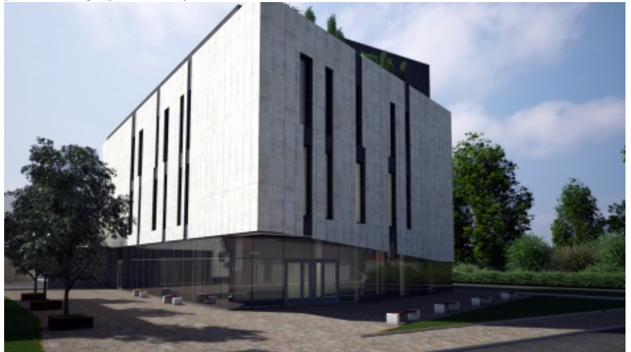
Wizualizacja budynku amfiteatru

zonie letnim dzięki dyszom podposadzkowym wytwarzana będzie mgiełka wodna, podświetlana zmiennie kolorowymi lampkami LED. Ponadto wybudowana zostanie granitowa kula o wadze 5 ton, którą obracać można ruchem ręki, która również podświetlona zostanie zmiennie kolorowymi lampkami LED. W nowym Rynku powstaną również ławki, kosze na śmieci, donice na zieleń ozdobną oraz oświetlenie. B.Ś.