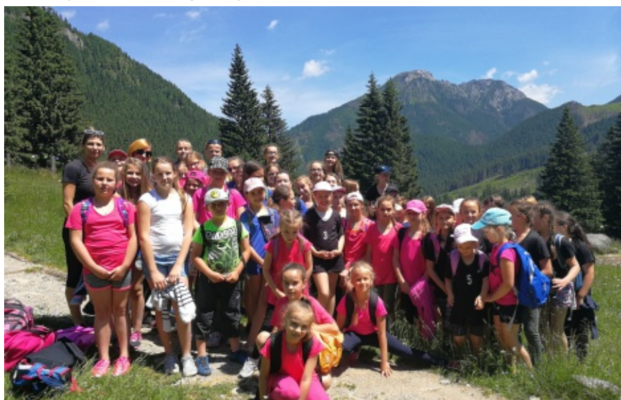
Wyjazd Iskierek do Chochołowa