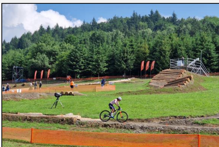
Kolarstwo górskie na IE 2023.