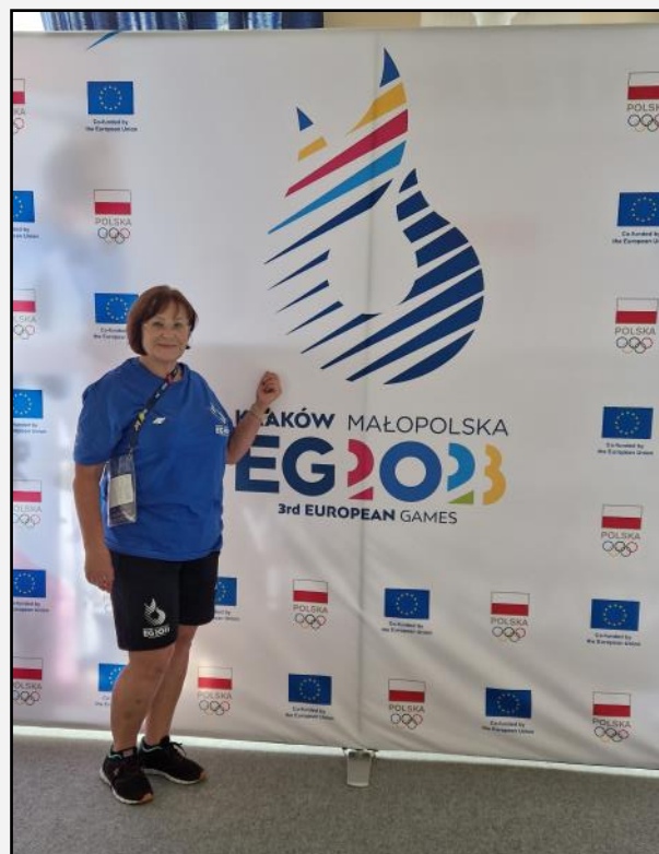
Pani Elżbieta jako wolontariuszka.

O możliwości podjęcia wolontariatu dowiedziałam się w naszym UTW. W grudniu 2022 roku