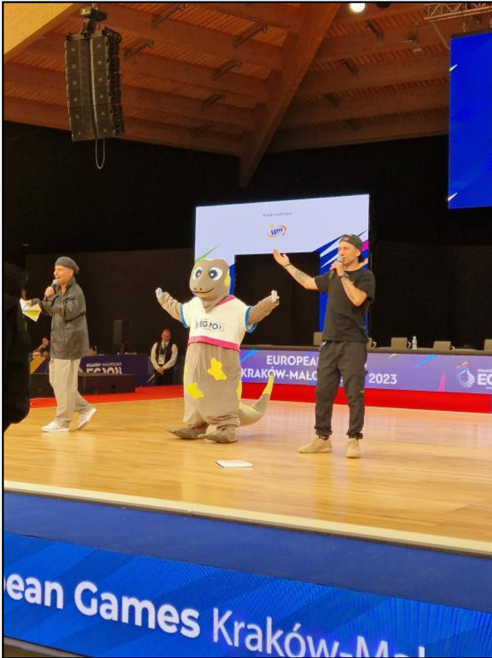
Zawody breakingu w Nowym Sączu – na scenie druga z maskotek IE 2023 – Salamandra Sandra.

Poznałam wielu ludzi w różnym wieku, z niektórymi nadal mam kontakt telefoniczny. Nie mam wątpliwości, że takie spotkania i wspólne przeżycia łączą, a to jest ogromna wartość.