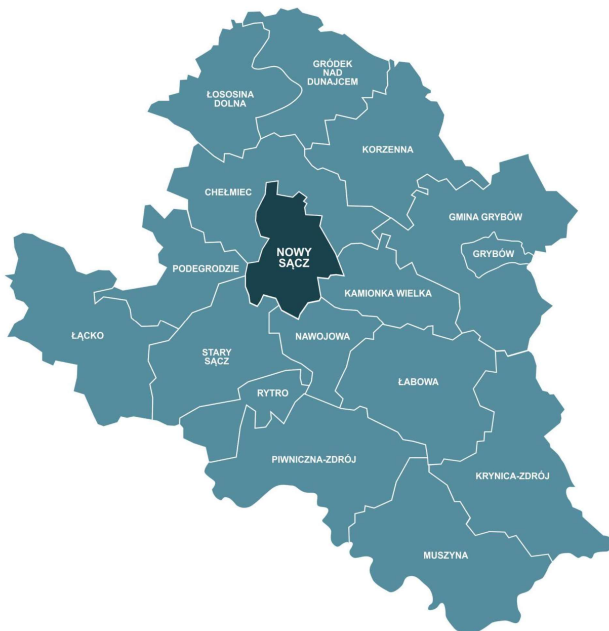
Rysunek 1. Zasięg Sądeckiego Obszaru Funkcjonalnego – Powiat nowosądecki i Miasto Nowy Sącz