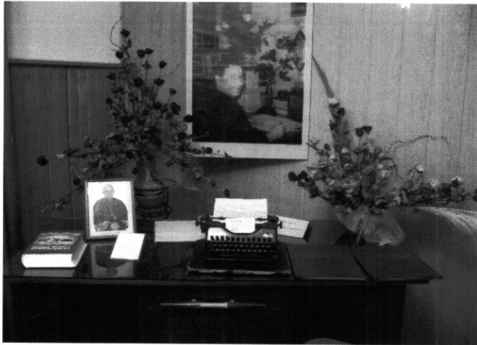
BIURKO, PRZY KTÓRYM PISAŁ SWOJE PRACE KSIĄDZ KUMOR