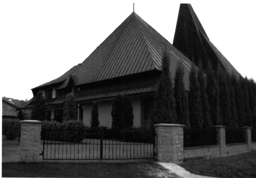
Kościół, który ksiądz Bolesław Kumor częściowo zbudował i honoraria przeznaczał na jego budowę