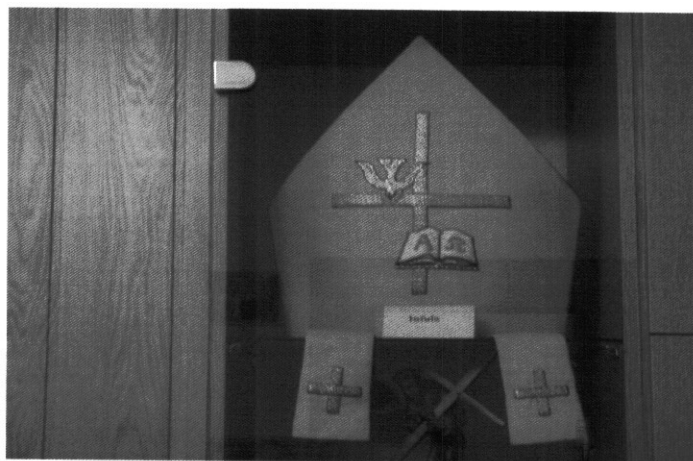
Infuła-(mitra), liturgiczne nakrycie głowy chrześcijańskich dostojników kościoła