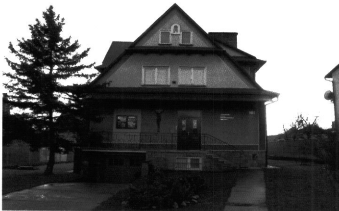
DOM SIÓSTR ZMARWYCHWSTANEK W NISKOWEJ