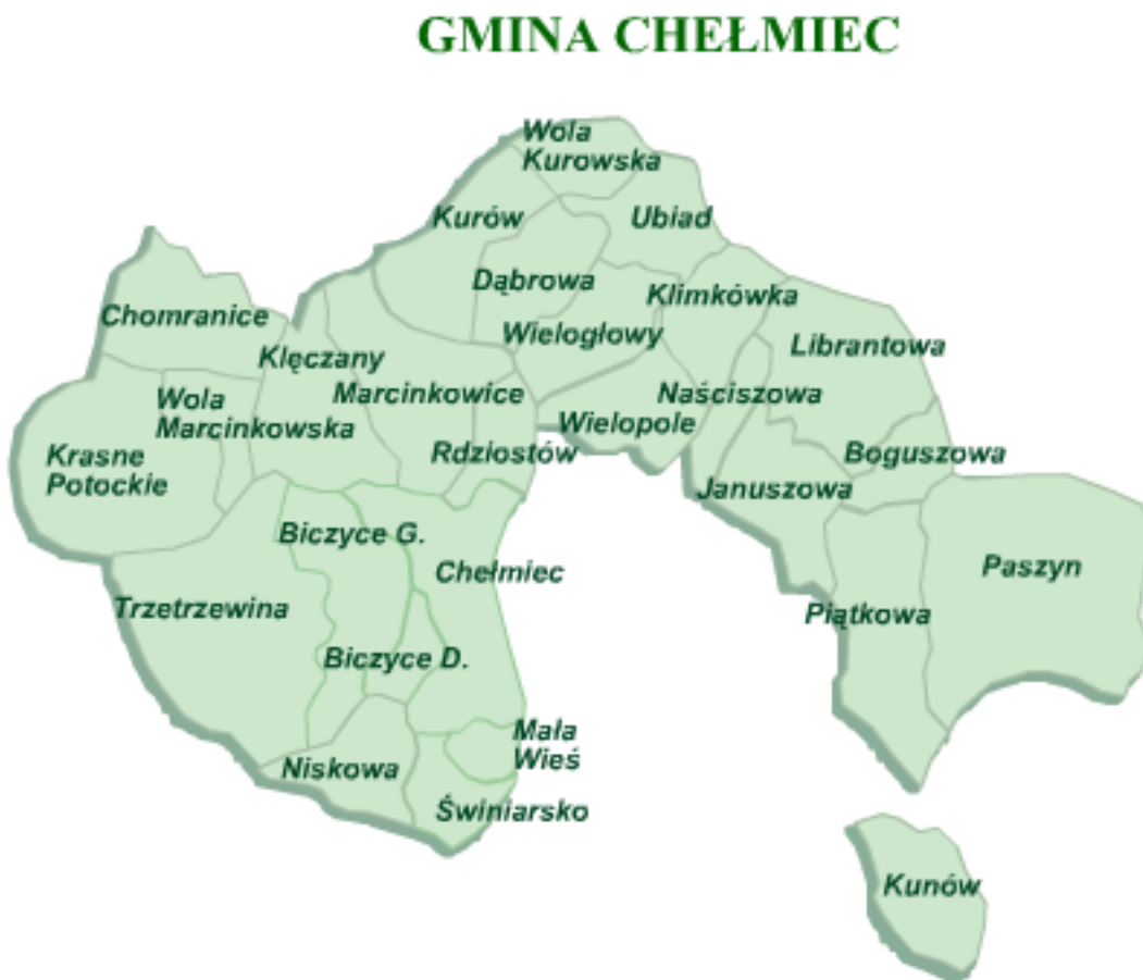
Ryc. 1. Gmina Chełmiec.

Zestawienie miejscowości gminy Chełmiec przedstawia rycina nr 1, natomiast jej położenie w powiecie przedstawia rycina nr 2.