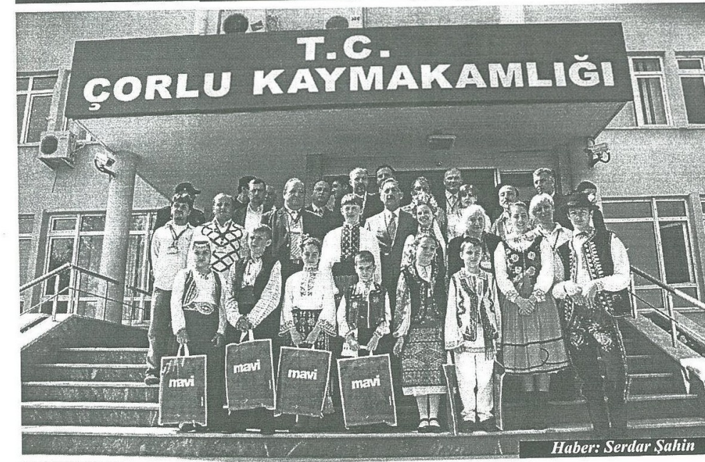
Haber: Serdar Şahin