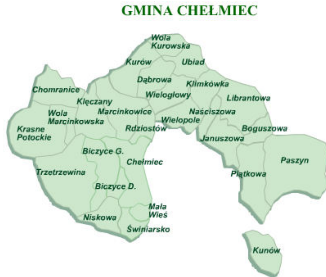
Ryc. 1. Gmina Chelmiec.

Zestawienie miejscowości gminy Chelmiec przedstawia rycina nr 1, natomiast jej położenie w powiecie przedstawia rycina nr 2.