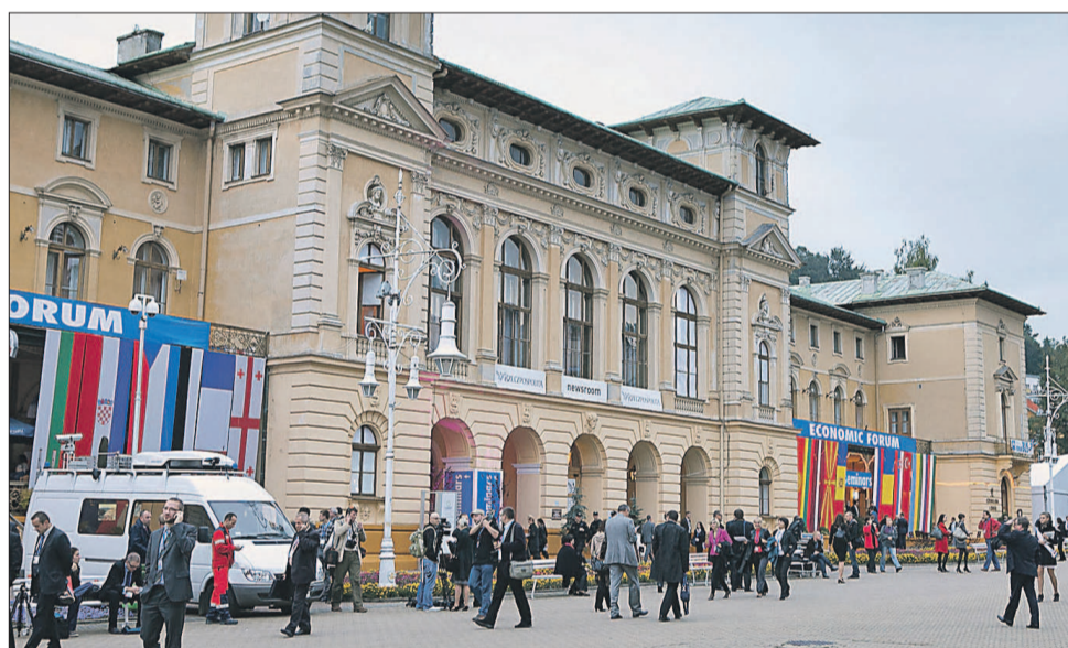
Od 20 lat organizatorzy Forum Ekonomicznego w Krynicy zamieniają na kilka wrześniowych dni uzdrowisko w centrum kongresowe.