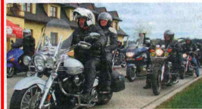
► Motocykliści od lat spotykają się przed ołtarzem papieskim w Starym Sączu. Tak amatorzy jednoślądów żegnali sezon 2013

Natomiast w niedzielę o godz. 10 odprawiona zostanie uroczysta msza święta, w czasie której poświęcone zostaną motocykle i skutery. Po nabożeństwie jednoślady wyruszą pod pomnik papieża na rynek w Nowym Sączu. ●