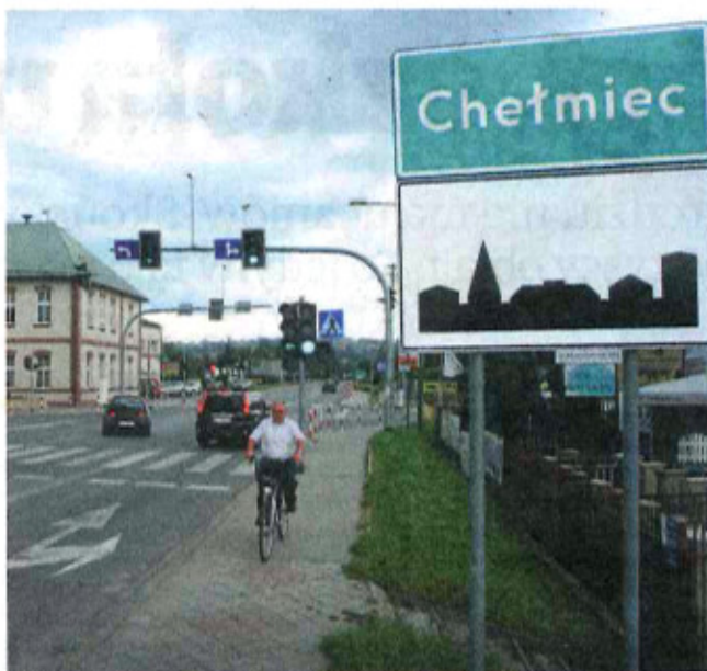
► Konsultacje społeczne mogą potrwać nawet dwa miesiące. Chełmczanie powiedzą, czy chcą mieszkać w mieście czy na wsi

- Przedsiębiorcy tak bardzo zainteresowali się miastem, że planujemy uruchomić specjalną strefę ekonomiczną na 12-hekta-