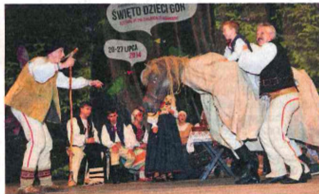
► Kyczerka zostawiła sądecczanom ważny przekaz: Nie zapomnieliśmy, skąd pochodzimy, jaka nasza wiara i kultura

To dobrze, że organizatorzy festiwalu skojarzyli w jeden dzień narody Greków i Łemków. Oba te narody mają w duszy wspomnienia własnej wielkości i tęsknotę za nią. Grecki zespół Pyrsos pochodzi ze starożytnego miasta o tej samej nazwie. W programie pokazanym we wtorek w hali MOSiR mnóstwo było odniesień do liczącej wiele tysięcy historii narodu, w której były momenty krwawe, walka o byt i tożsamość. Przypominały o tym m.in. zbroje i krótkie szable tańczących bojowo chłopców przypomina-