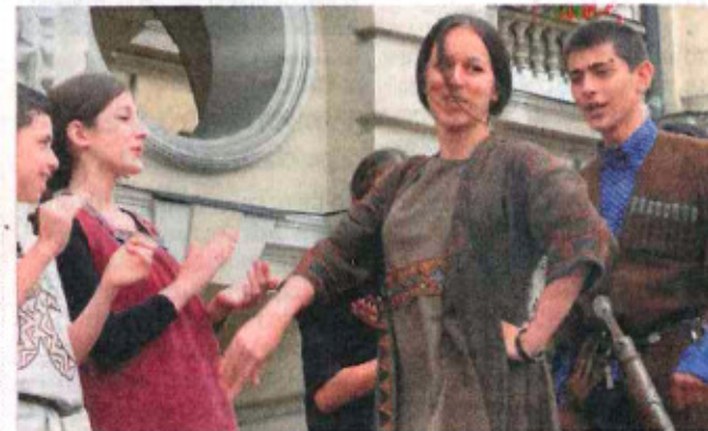
► Teraźniejszość i starożytność mieszała się w tańcach i strojach urodziwych dziewcząt i rosnących chłopaków zespołu Pyrsos

skąd pochodzą, jakie są ich dzieje, jaka jest łemkowska kultura i tradycja. Zespół Kyczerka wywiódł swoją opowieść o Łemkowninie ze święta Jordana, obchodzonego w obrządku wschodnim na pamiątkę chrztu Chrystusa. Święto otwierało czas zabaw i powszechnie manifestowanej radości. Zaczęły je najmłodsze dzieci, później ich