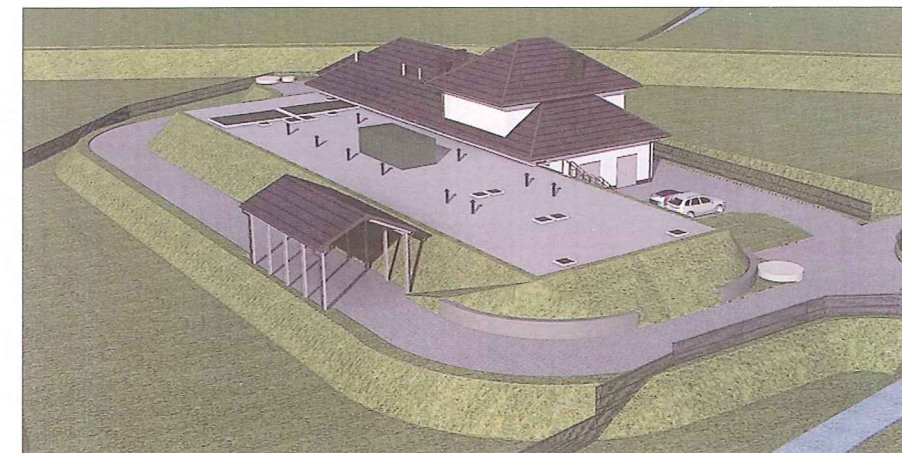
Konceptcja oczyszczalni ścieków w Wielogłowach

Rozbudowana infrastruktura i przyjazny klimat dla rodziny powoduje że w gminie osiedla się ponad 100 mieszkańców na rok, a łącznie z dodatnim bilansem urodzin daje to ponad 300 nowych mieszkańców każdego roku.