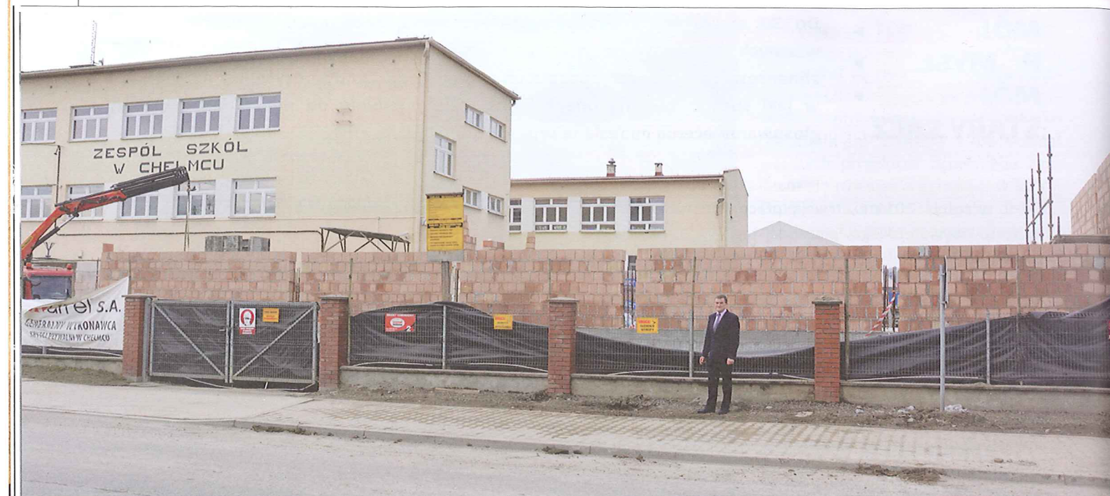
Budowa krytej pływalni w Chełmcu