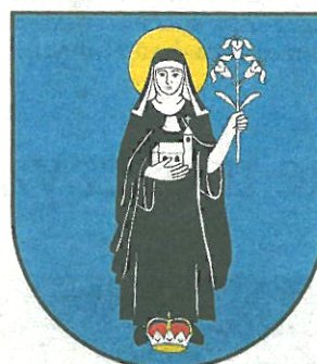
► Nowy herb Starego Sącza

- Cieszę się, że Stary Sącz dojrzał do zmiany herbu. Prze-