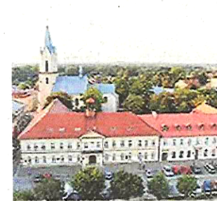
9. Oświęcim (miasto)