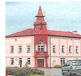
19. Bolesław (pow. olkuski)