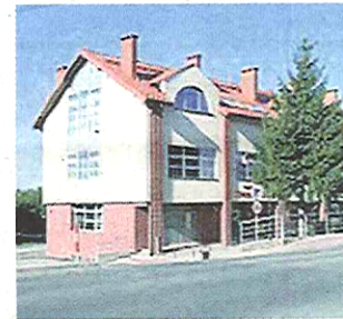
13. Świątniki Górne