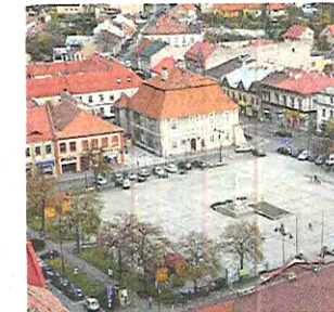
20. Bochnia (miasto)