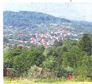
6. Sucha Beskidzka