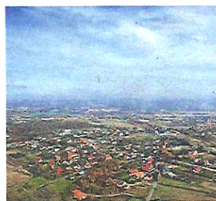
1. Wielka Wieś

Pełne wyniki rankingu dostępne na: http://mistia.org.pl/ranking