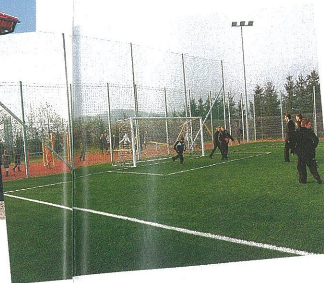
Orlik w miejscowości Wielogłowy