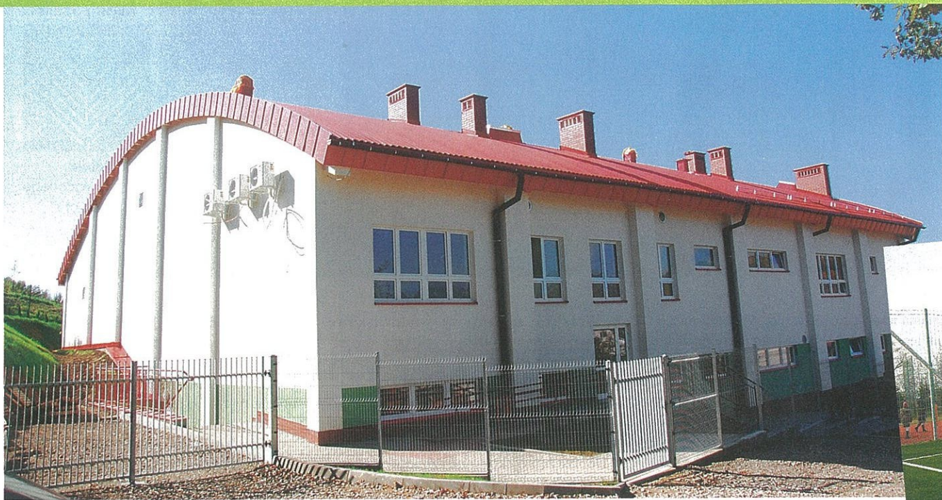
◀ Nowa hala sportowa w Piątkowej