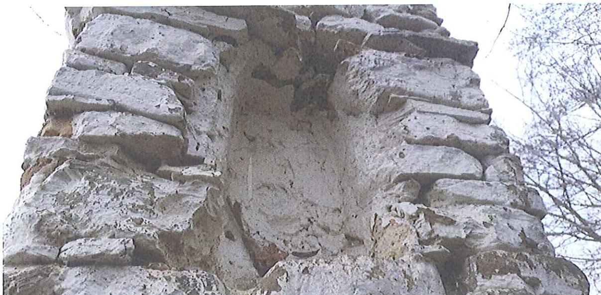
Fot.12. Kapliczka w Biczycach Górnych- widok na wnękę umieszczoną na tylnej ścianie kapliczki . Luty 2020