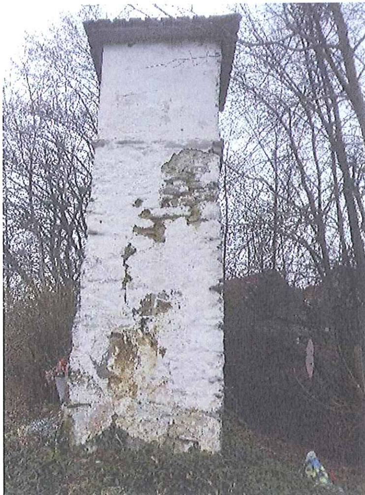
Fot.15. Kapliczka w Biczycach Górnych- widok ogólny . Luty 2020

W pierwszej kolejności zaleca się delikatne odkopanie kapliczki i wykonanie betonowej opaski stabilizującej ściany kapliczki. Zbrojoną opaskę zaleca się wykonać na podsypce żwirowej. Od góry w beton wstawić nieregularne kamienie i otoczaki z piaskowca. Następnie należy przystąpić do usuwania wtórnych zapraw oraz farb i pobiał. Prace należy wykonywać bardzo starannie i pod nadzorem konserwatora. Zaleca się czyszczenie ręczne, stopniowe usuwanie nawarstwień za pomocą skalpela, dłut, skrobaków.