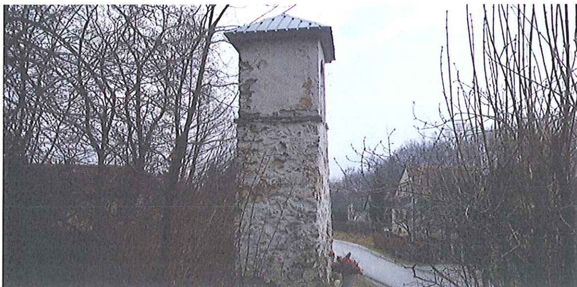
Fot.4. Kapliczka w Biczycach Górnych- widok ogólny . Luty 2020

Kapliczka w Biczycach Górnych stanowi cenny przykład kapliczek słupowych terenu Sądeczyny. Jej największym urokiem jest jej autentyczność. Wybudowana z kamienia i gliny, również gliną pierwotnie została wylepiona i pomalowana wapnem. Duża ilość pobrań świadczy o wielokrotnym jej odmalowywaniu.