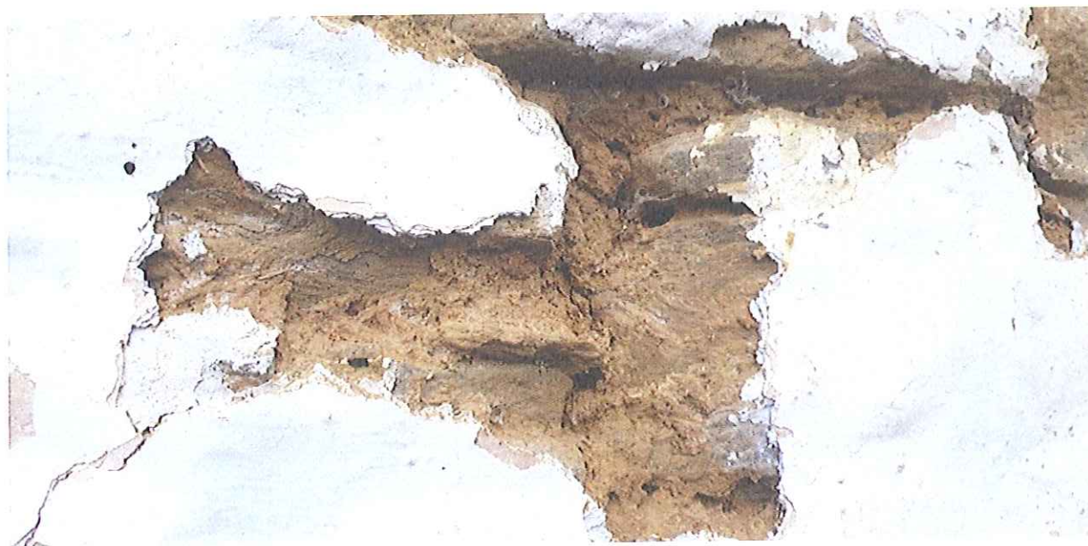
Fot.8. Kapliczka w Biczycach Górnych- widok na liczne ubytki pobiał oraz wykruszenia gliny . Luty 2020