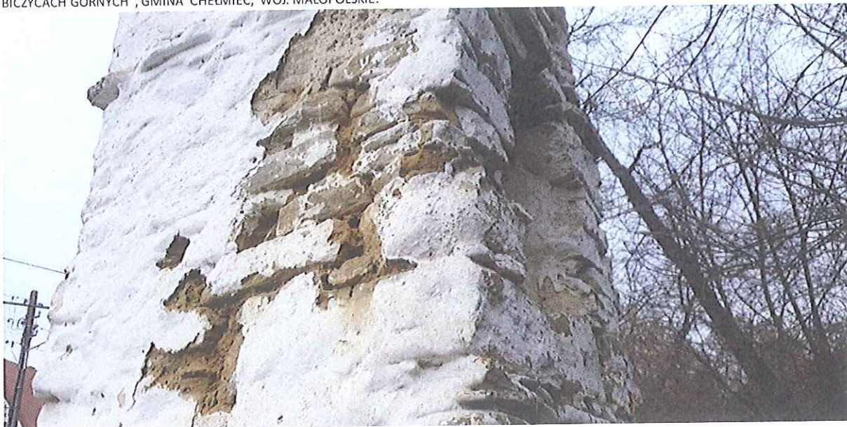
Fot.7. Kapliczka w Biczycach Górnych- widok na liczne ubytki pobiał oraz wykruszenia gliny . Luty 2020

PROGRAM KONSERWATORSKI DOTYCZĄCY PRAC RENOWACYJNYCH PRZY PRZYDROŻNEJ KAPLICZCE SŁUPOWEJ W BICZYCACH GÓRNYCH, GMINA CHEŁMIEC, WOJ. MAŁOPOLSKIE.