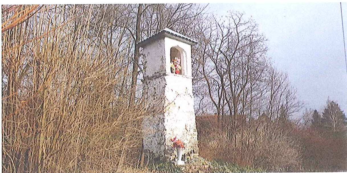
Fot.13. Kapliczka w Biczycach Górnych- widok ogólny . Luty 2020.

Reasumując należy stwierdzić ,że stan zachowania kapliczki jest zły. Szczególnie zniszczony jest kamień /przyczynia się do tego bliskość drogi i wzmożony ruch samochodowy/ . Wyprawy z pobiałami są spękane i odpadają .Należy niezwłocznie przystąpić do prac konserwatorskich.