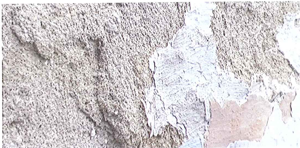
Fot.6. Kapliczka w Biczycach Górnych- fragment ; widoczne resztki pobiał i zmurzały tynk. Luty 2020