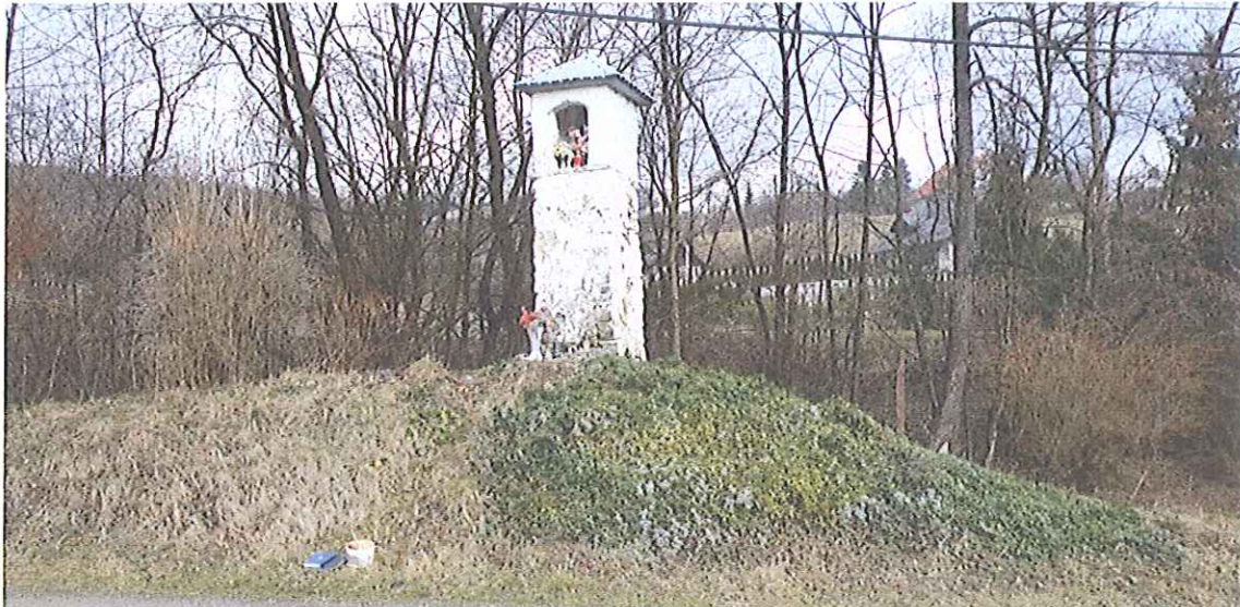
Fot.3. Kapliczka w Biczycach Górnych- widok ogólny . Luty 2020

PROGRAM KONSERWATORSKI DOTYCZĄCY PRAC RENOWACYJNYCH PRZY PRZYDROŻNEJ KAPLICZCE SŁUPOWEJ W BICZYCACH GÓRNYCH, GMINA CHEŁMIEC, WOJ. MAŁOPOLSKIE.