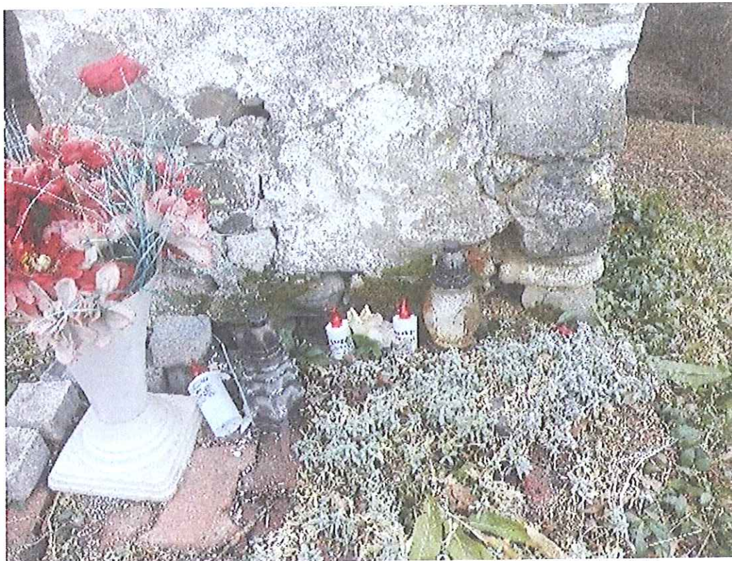
Fot.5. Kapliczka w Biczycach Górnych- Dolne partie kapliczki z ubytkami wypraw i pobiał, porażone przez mchy i porosty . Luty 2020.

PROGRAM KONSERWATORSKI DOTYCZĄCY PRAC RENOWACYJNYCH PRZY PRZYDROŻNEJ KAPLICZCE SŁUPOWEJ W BICZYCACH GÓRNYCH, GMINA CHEŁMIEC, WOJ. MAŁOPOLSKIE.