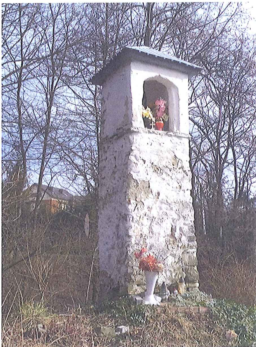
Fot.14. Kapliczka w Biczycach Górnych- widok ogólny . Luty 2020

PROGRAM KONSERWATORSKI DOTYCZĄCY PRAC RENOWACYJNYCH PRZY PRZYDROŻNEJ KAPLICZCE SŁUPOWEJ W BICZYCACH GÓRNYCH, GMINA CHEŁMIEC, WOJ. MAŁOPOLSKIE