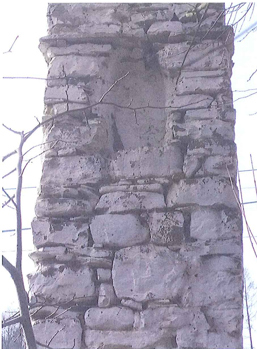
Fot.17. Kapliczka w Biczycach Górnych- widok na wnękę w tylnej ścianie kapliczki. Luty 2020.