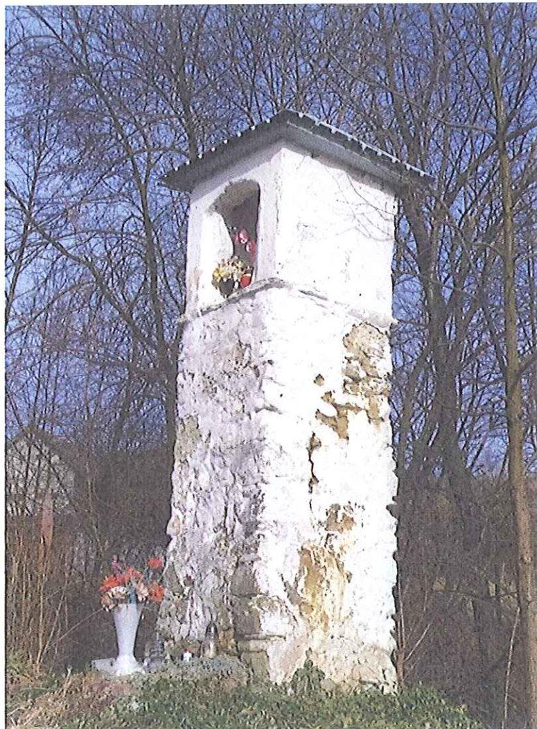
Fot.16. Kapliczka w Biczycach Górnych- widok ogólny . Luty 2020

Na koniec ściany kapliczki należy alternatywnie