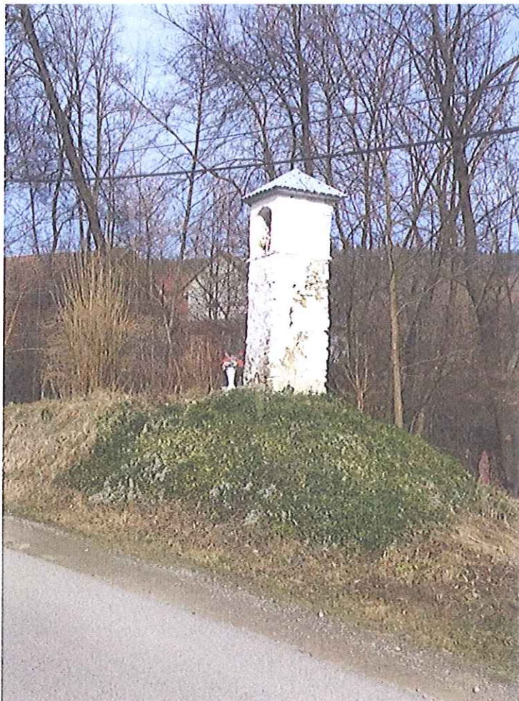
Fot.18. Kapliczka w Biczycach Górnych- widok ogólny . Luty 2020.